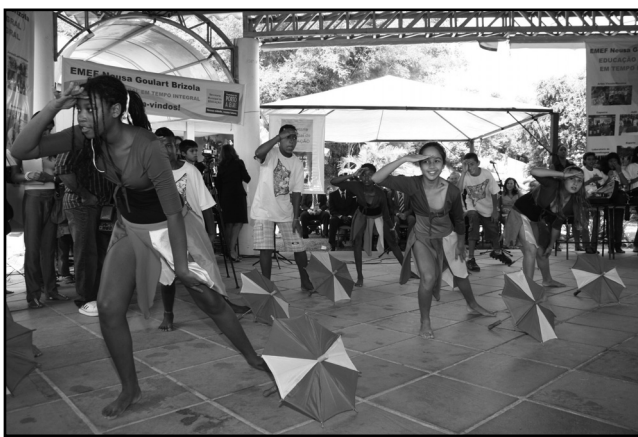
No turno inverso ao da aula, estudantes têm aulas de dança

Leia mais no http://www.portoalegre.rs.gov.br/portal_pmpa_novo/