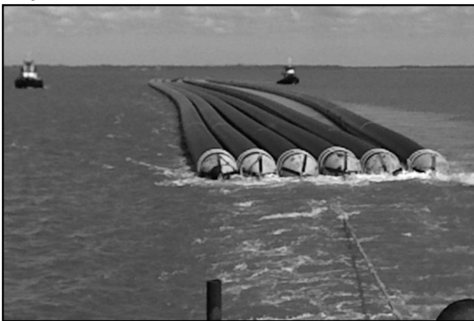
Tubos integram obra do Emissário, com 11,3 km de extensão

M ais seis tubos para a construção do Emissário Subaquático do Projeto Integrado Socioambiental (Pisa) chegaram ontem, 28, à Capital. As tubulações saíram do Porto de Santos em direção a Rio Grande na semana passada.