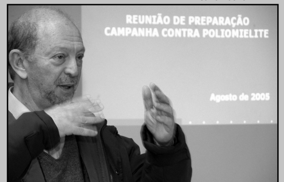
Scliar também era médico e foi parceiro da prefeitura em diversas campanhas

A prefeitura une-se às manifestações de pesar pelo falecimento do escritor Moacyr Scliar, solidarizando-se com seus familiares e leitores, admiradores e amigos. O prefeito lamenta com pesar o falecimento do escritor porto-alegrense, ocorrido na madrugada de domingo, 27, na Capital. Para homenageá-lo, a semana comemorativa aos 239º aniversário da cidade levará o seu nome: Semana de Porto Alegre Moacyr Scliar. A semana, que ocorrerá de 19 e 26 de março, terá sua programação alterada para homenagear o autor, membro da Academia Brasileira de Letras. Por meio da Secretaria Municipal de Cultura, serão organizadas diversas atividades. Já estão confirmadas iniciativas como debates sobre a obra de Scliar, leitura pública e exposições.