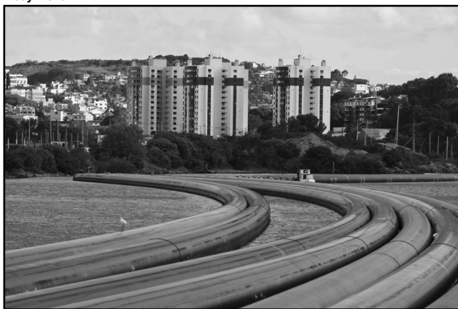
Tubos para o Emissário Subaquático possuem 515 metros de comprimento cada e 1,60 m de diâmetro

construída a terceira torre de menor porte.