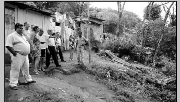
Comunidade pediu ajuda