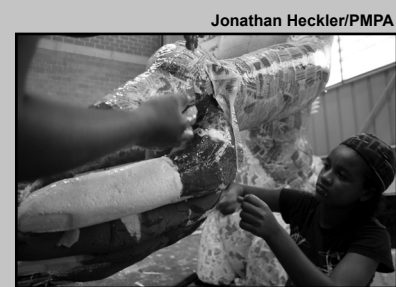
Escola trabalha nos barracões para defender título de campeã