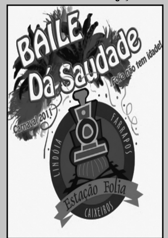
Baile será amanhã, no Caixeiro Viajantes

O Baile Dá Saudade – Folia Não Tem Idade abrirá a temporada dos bailes de Carnaval de Salão do Estação Folia 2011 na sexta-feira, 4, a partir das 17h, no Clube Caixeiros Viajantes. Dirigido especialmente ao público da terceira idade, da Capital e do interior do Estado, o baile terá edição única com o tema Faraós e Rainhas do Egito e irá premiar a fantasia mais original e o bloco mais animado. De 5 a 7 de março, os bailes para o público adulto em geral serão oferecidos de forma alternada nos três clubes de Porto Alegre que há oito anos promovem o Estado Folia: além do Caixeiros, o Lindóia Tênis Clube e o Farrapos.