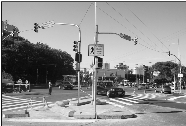
Sistema de semáforos foi instalado no encontro da Nilo Peçanha e as ruas Carazinho e Carlos Trein Filho

P ontualmente às 9h30 desta quarta-feira, 2, e com 40 dias antes do prazo previsto, o prefeito acionou o botão que colocou em funcionamento o novo sistema de semáforos instalados no encontro da avenida Nilo Peçanha e as ruas Carazinho e Carlos Trein Filho. Sob o sol forte e observado por populares, o prefeito atendeu uma reivindicação da população que não estava satisfeita com a rotatória instalada no local e que prejudicava o fluxo do trânsito, criando igualmente dificuldades para os pedestres. “Estou convencido de que esta obra é muito simples em muitos aspectos, mas também tenho a certeza de que ela vai trazer mais qualidade de vida para quem passa aqui, seja de carro ou a pé. Sem dúvida, as sinaleiras são muito mais seguras para os pedestres”.