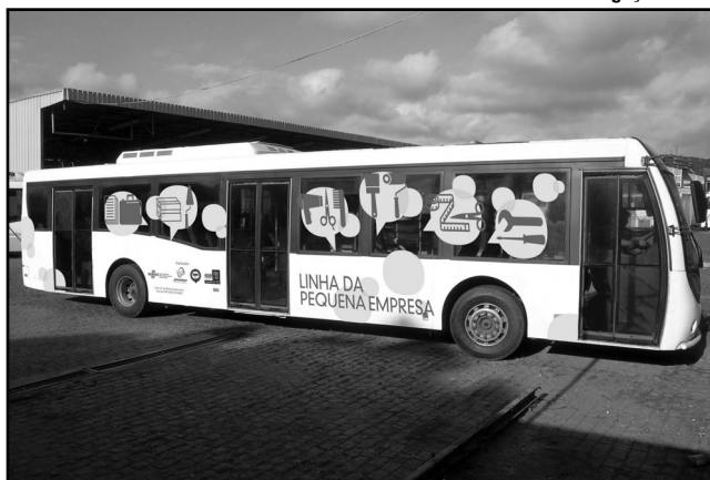
De abril a dezembro, ônibus percorrerá os bairros da Capital

O atendimento nos ônibus será de segunda a sexta-feira, das 9h às 18h. Começa no dia 4 de abril. Uma das metas desse trabalho é aumentar o número de Empreendedores Individuais, chegando a 103.500 até o final de 2011 no Estado.