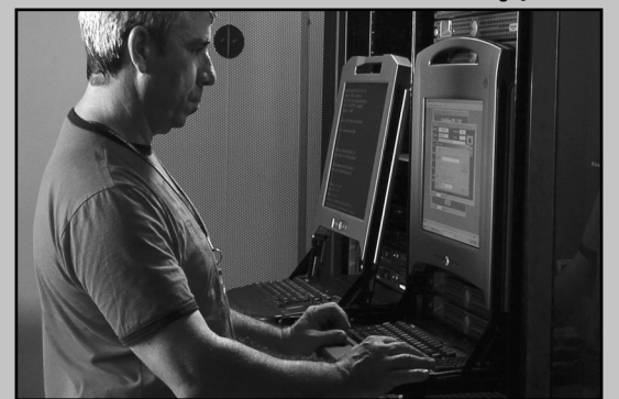
Procempa investiu na virtualização de 155 máquinas em 2010

Investimentos na virtualização do parque das máquinas “servidores” da Procempa integram-se às iniciativas da empresa para eficientizar e reduzir o consumo de energia nas ações do Programa Procempa Verde. A criação de máquinas virtuais permite diminuir o número de servidores físicos, utilizando uma única infraestrutura capaz de controlar diversas máquinas virtuais. Estudos apontam que as máquinas virtuais podem reduzir entre 30% e 60% o consumo de energia das empresas. Só em 2010, a Procempa investiu na virtualização de 155 máquinas.