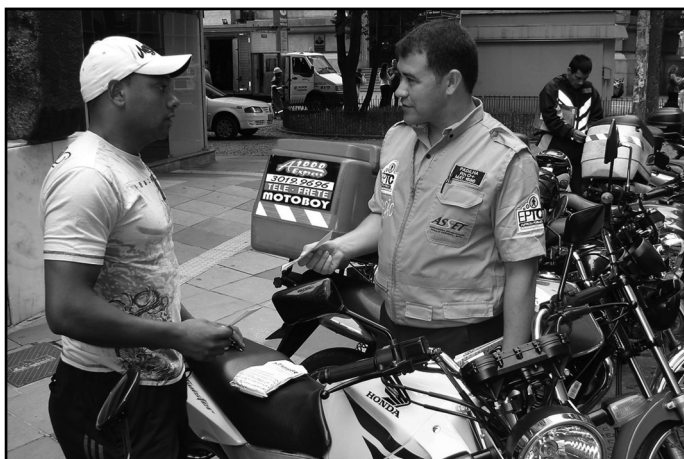
Trânsito registrou 13 mortes em fevereiro, sendo oito de motociclistas