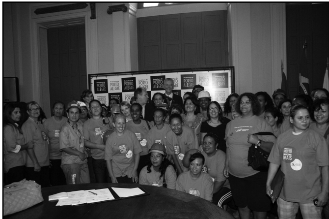
Protocolo de intenções que viabiliza os cursos foi assinado na última sexta-feira

é desenvolvido pela Secretaria Municipal da Produção, Indústria e Comércio (Smic) e pelo Gabinete de Planejamento Estratégico (GPE), como forma de incentivar a complementação de renda familiar, através do Cresce Porto Alegre, um dos programas estratégicos da administração municipal.