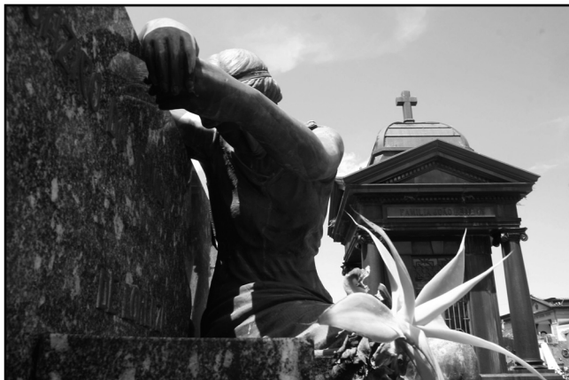
Cemitérios exibem ícones evidentes da arte tumular, diz pesquisadora

No dia em que Porto Alegre completa 239 anos, sábado, 26, a caminhada orientada Viva o Centro a Pé vai percorrer a Arte Cemiterial da cidade, um verdadeiro museu a céu aberto, com roteiro pelos cemitérios da Santa Casa e Evangélico.