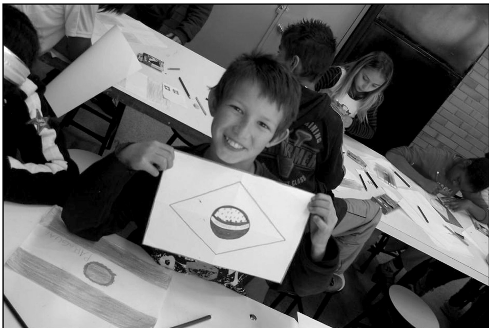
Atividades mobilizarão comunidades escolares ao longo do ano

A té 30 de março, estão abertas as inscrições para a 3ª Gincana Solidária, organizada pela Secretaria Municipal da Educação (Smed). As atividades ocorrerão entre abril e novembro, envolvendo instituições de Educação Infantil e dos Ensinos Fundamental e Médio da rede municipal de ensino. As inscrições devem ser feitas no site oficial da gincana.