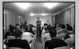
Curso tem 70 vagas

Estão abertas as inscrições para o Curso de Arbitragem de Futebol realizado pela Secretaria Municipal de Esportes, Recreação e Lazer (SME), destinado a homens e mulheres acima de 18 anos. O curso será dividido em duas etapas: teórica e prática. A primeira fase, com 18 horas, contará com aspectos educativos da arbitragem, regras oficiais, técnicas de arbitragem e preenchimento de súmula. A segunda, com 22 horas, inclui observação e análise de jogos e arbitragem de jogos do campeonato municipal, categorias pré-mirim, mirim e infantil. Inscrições na Av. Érico Veríssimo, 843, de segunda a sexta-feira, das 9h às 12h e das 14h às 18h.