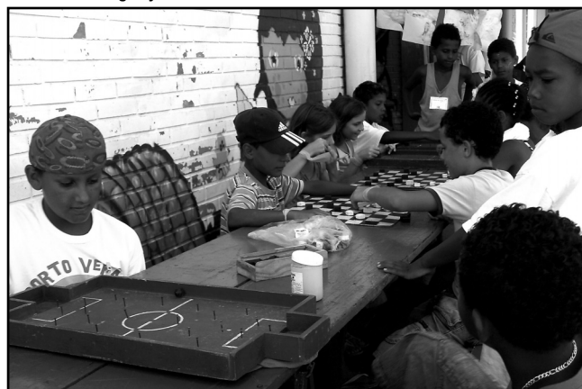
Atividades integram escolas municipais e comunidade

Chapeu do Sol, no bairro Chapeu do Sol, por exemplo, cerca de 60 pessoas, entre alunos e moradores da comunidade, participam semanalmente das oficinas do programa. Lá, são oferecidas oficinas de futsal, jardinagem, artesanato e dança de rua, sempre aos sábados, das 8h às 12h e das 13h às 17h.