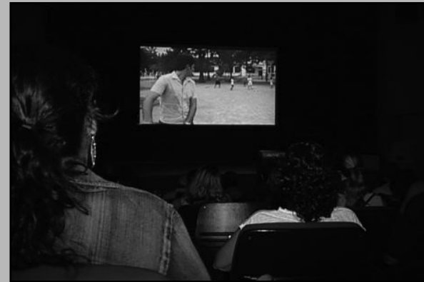
Cinema no Teatro Glênio Peres

Na semana do Dia do Cinema Gaúcho (27 de março), os porto-alegrenses puderam participar, gratuitamente, de uma oficina sobre o tema e assistir ao filme Em teu Nome. O evento inaugurou o projeto Terças InCâmara, no Teatro Glênio Peres da Câmara Municipal de Porto Alegre.