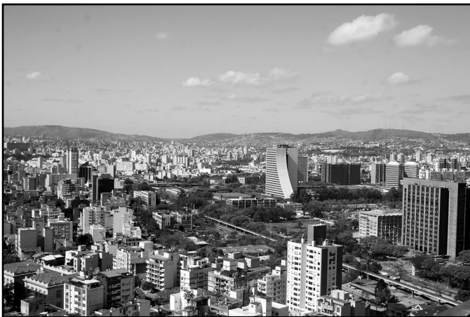
Balanço de 2010 registra o maior investimento da década

O prefeito entrega hoje, 29, às 10h, o Balanço das Finanças Públicas e o Relatório de Atividades 2010 à presidente do Legislativo. Além dos documentos formais previstos na Lei Orgânica, será entregue aos vereadores a versão ilustrada do balanço, uma publicação que traz a síntese dos dados sobre a aplicação dos recursos municipais, em linguagem acessível e objetiva. Depois da solenidade no Salão Nobre do Legislativo, o arquivo será disponibilizado à consulta do cidadão no site da Secretaria Municipal da Fazenda - www.portoalegre.rs.gov.br/smf .