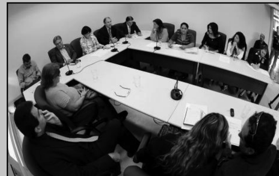
Moradores estiveram na Cedecondh

A Comissão de Defesa do Consumidor, Direitos Humanos e Segurança Urbana (Cedecondh) da Câmara Municipal de Porto Alegre recebeu, na terça-feira (29/3), representantes de moradores do Jardim Floresta que residem em imóveis desapropriados para a ampliação da pista do Aeroporto Salgado Filho entre a Rua Ouro Preto e a Avenida Polar. As 42 famílias alegam que os proprietários foram indenizados pela Infraero, mas não comunicaram aos inquilinos que estes deveriam desocupar as casas em 90 dias.