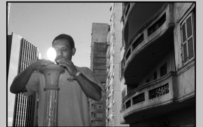
De 2007 para cá, houve redução de 74,5% nos investimentos em recuperação

A Campanha de Combate ao Vandalismo da Smov vem registrando economia para os cofres públicos. Já no ano do lançamento, em 2007, foram investidos R$