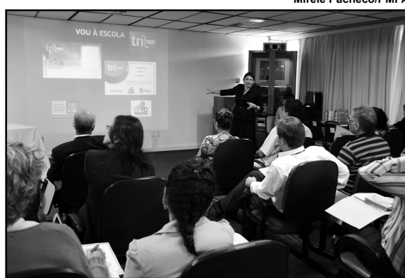
Comissão do Vou à Escola fez primeira reunião de trabalho

O Vou à Escola (ensino fundamental) oferece a alunos desse nível, de seis a 18 anos incompletos, transporte gratuito, garantindo o acesso e a permanência na escola, quando da inexistência de vaga em escola pública próxima à residência. É administrado pela prefeitura, por intermédio da Smed e Empresa Pública de Transporte e Circulação (EPTC), em parceria com o Ministério Público (MP), Conselho Tutelar, S.E. Consórcios e comunidade escolar.