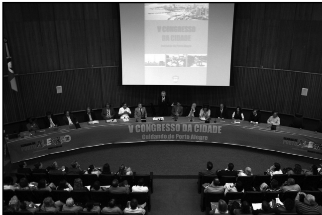
Lançamento do 5º Congresso da Cidade ocorreu no último dia 24

Também nos bairros, as lideranças formam um comitê para a mobilização e a articulação do território.