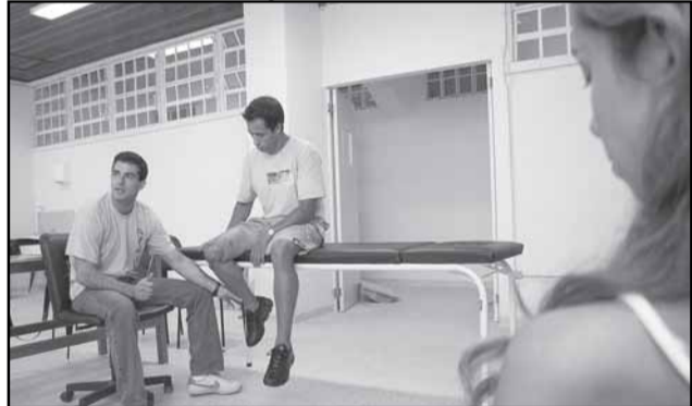
Clínica já atendeu mais de mil pessoas nesses dois anos

Para comemorar o segundo ano da Clínica Pública de Fisioterapia Esportiva, a Secretaria Municipal de Esportes, Recreação e Lazer (SME) realiza nesta segunda-feira, 29, um coquetel comemorativo com os pacientes. Iniciativa inédita no sul do país, a clínica pública com