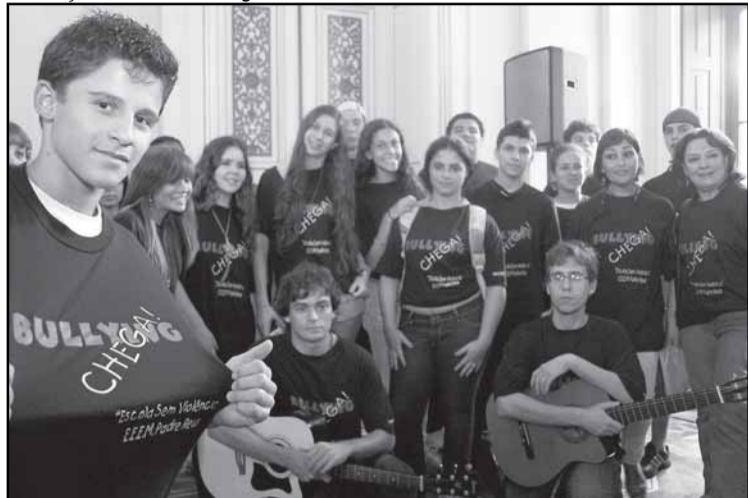
Coral da escola Padre Réus fez apresentação na solenidade

A lei municipal para o desenvolvimento da política “antibullying” por instituições de ensino e de educação infantil públicas municipais ou privadas foi sancionada na última sexta-feira. A lei tem como objetivo reduzir a prática de violência dentro e fora das escolas, melhorando o desempenho escolar e promovendo cidadania e respeito, além de divulgar informações sobre o “bullying”.