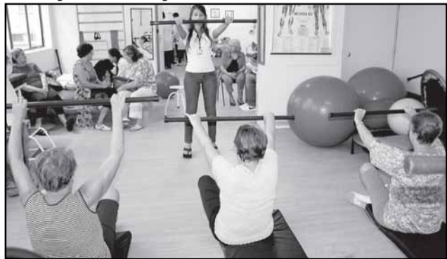
São atendidos cerca de 600 pacientes ao mês, sendo que 70% são idosos

O Centro de Saúde IAPI (rua 3 de Abril, 90, bairro Passo D’Areia) realiza semanalmente ações de promoção, reabilitação e vigilância em saúde aos usuários da unidade. O novo espaço integra o serviço de fisioterapia, oferecido à comunidade em parceria com a Rede Metodista de Educação do Sul (IPA). A equipe também realiza atendimento domiciliar de pacientes acamados que residem próximo ao Centro de Saúde.