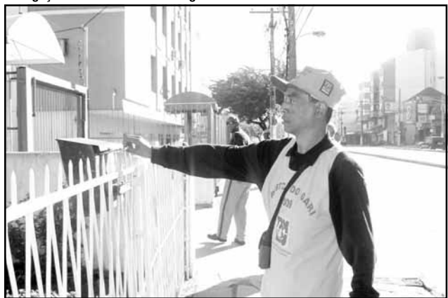
A tarefa da Assessoria Comunitária consiste em atuar na conscientização das comunidades