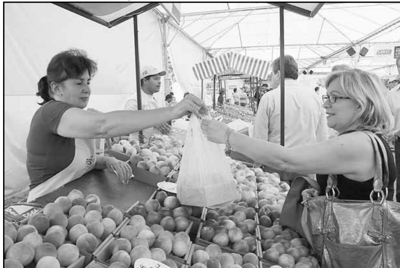
A Festa do Pêssego comemora 25 anos em 2009 e será realizada em quatro finais de semanas