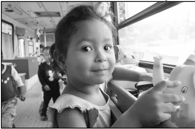
Projeto leva diversão para as crianças em escolas e eventos

A Feira é uma realização da Câmara Rio-Grandense do Livro com apoio das leis estadual e federal de incentivo à cultura. Com a participação de mais de 170 expositores livreiros, concentrará atividades e estandes nos entornos da Praça da Alfândega, como o Centro Cultural CEEE Erico Verissimo, o Memorial do Rio Grande do Sul, o Santander Cultural além do Cais do Porto.