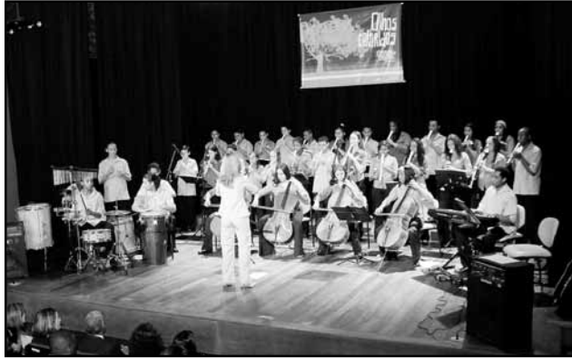
Orquestra de Flautas Villa-Lobos se apresenta no dia 14, às 17h, no Teatro Sancho Pança

Em sete meses, foram removidas cerca de 1.640 toneladas de entulhos, material que os moradores não conseguem encaminhar normalmente nem à coleta domiciliar nem à coleta seletiva. A pro-