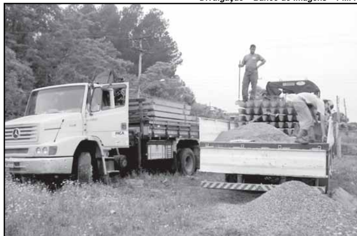
Investimentos ultrapassam R$ 800 mil