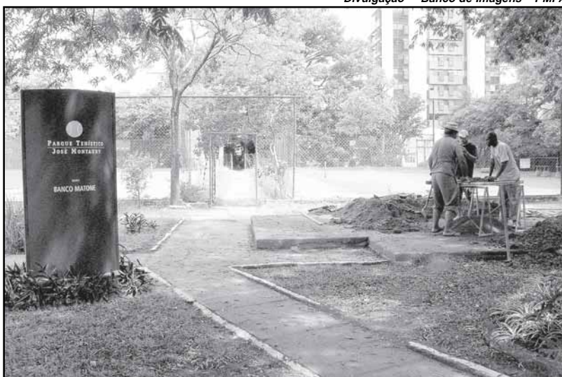
Primeira quadra, de três existentes, está em fase de finalização

Vegas, além de representantes também de cidades do Texas e Flórida. Haverá exposições de técnicos da Empresa Pública de Transporte e Circulação (EPTC), Companhia Carris Porto-Alegrense (Carris), Associação dos Transportadores de Passageiros (ATP) e da Associação dos Transportadores de Lotação (ATL), entidades apoiadoras do evento.