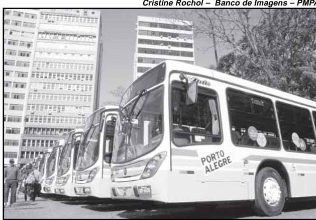
Carris conta com 201 veículos renovados na frota desde 2006

pesquisa realizada de 14 a 22 de maio de 2009 com o objetivo de identificar o comportamento dos motoristas de Porto Alegre quanto ao respeito à sinalização de trânsito, à faixa de segurança e ao pedestre. A amostra foi realizada com 1012 entrevistados entre motoristas e pedestres.