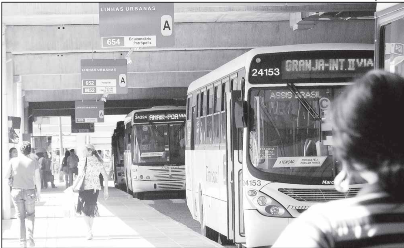
Projeto vai racionalizar a circulação de ônibus no Centro