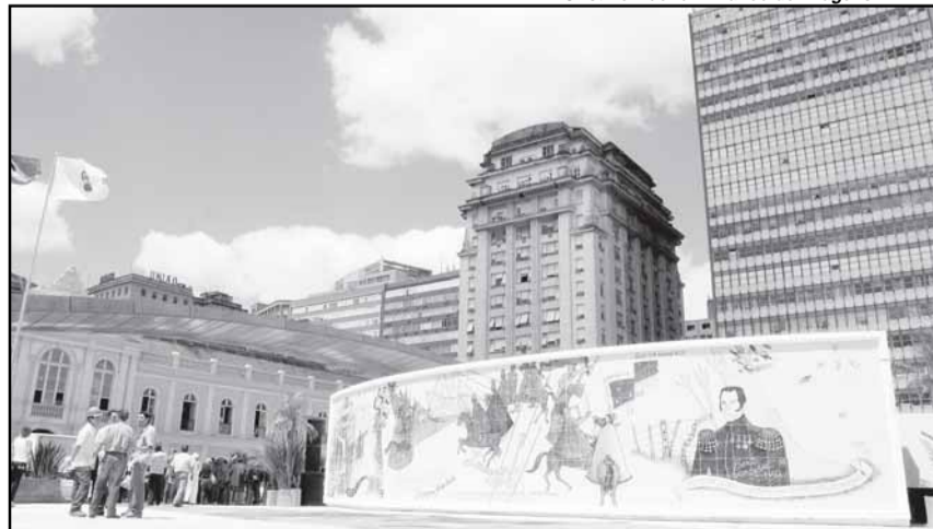
Entre as melhorias já implantadas estão as obras de remodelação da Praça Revolução Farroupilha