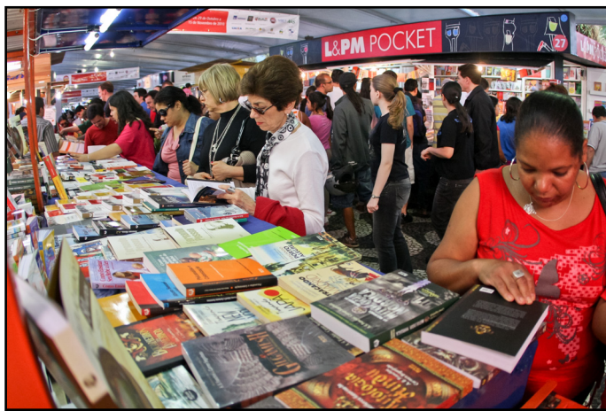
A Praça da Alfândega abriga atualmente a 56ª Feira do Livro

Roteiro - Do roteiro, constam o Caminho dos Antiquários, Viaduto Otávio Rocha, Museu Júlio de Castilhos (visitação interna), Praça da Matriz, Museu da Eletricidade do RS – CCCEV (visitação interna), Praça da Alfândega e Museu Hipólito José da Costa (visitação interna).