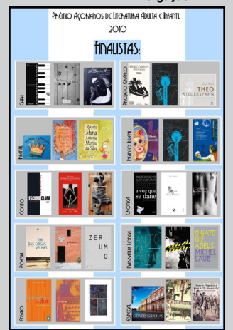
Finalistas do Prêmio Açorianos de Literatura Adulta e Infantil 2010

Na sua 16ª edição, o Prêmio Açorianos de Literatura Adulta e Infantil premiará dez livros e dois destaques literários. A Noite de premiação será em 13 de dezembro, às 20h, no Teatro Renascença. Nesse dia, além de conhecer os vencedores de cada categoria, serão anunciados os destaques do ano. Concorrem editoras e/ou livrarias, projetos de incentivo, mídia digital e impressa, rádio e TV. O Livro do Ano receberá um prêmio de R$ 10 mil e a coletânea inédita vencedora do Prêmio Açorianos de Criação Literária/Conto receberá R$ 10 mil e a publicação da obra.