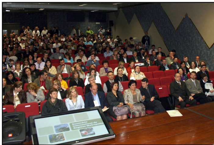
Objetivo do encontro é promover a troca de experiências entre metrópoles

O seminário reuniu prefeitos (as), gestores estaduais e federais, além de entidades municipalistas, representantes de organizações não-governamentais, instituições financeiras e empresariais, agências internacionais e universidades.