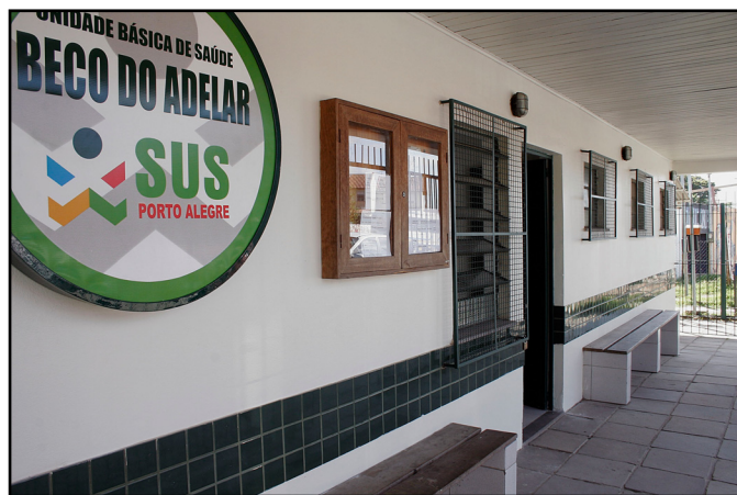
PSF Beco do Adelar é um dos locais que será visitado

(demanda de 2008), a comitiva visitará os locais onde as mesmas serão construídas. Essas creches constam na lista de demandas atrasadas do OP e serão priorizadas, conforme definido em reunião com a comunidade.