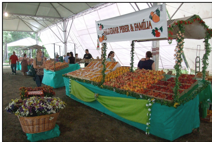
Festa ocorre no Centro de Eventos Rurais da Vila Nova, até domingo, 21

Além do pêssego, a uva e o vinho também estão entre as atrações do roteiro. No Sítio Dom Guilherme, no bairro Belém Velho, serão visitados parreirais da propriedade, que também se dedica a pomares de frutas variadas, e conhecidos detalhes do processo de elaboração de vinhos artesanais. Outro atrativo do roteiro será a visita ao Recanto das Pedras, onde será servido almoço. O local oferece área para caminhada na mata nativa, horta pedagógica de cultivo orgânico e a produção de óleo essencial de alecrim, a partir de matéria-prima local.