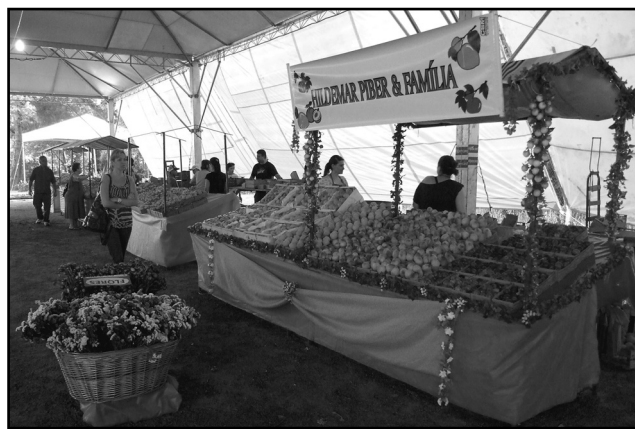
Festa ocorre no Centro de Eventos Rurais da Vila Nova, até domingo, 21

A 26ª Festa do Pêssego, uma das opções da rota Caminhos Rurais de Porto Alegre, será um dos atrativos da próxima edição do Domingo no Campo, programado para o dia 14. Além de conferir a qualidade da fruta produzida na Zona Sul da Capital, os participantes do roteiro terão uma boa oportunidade de adquirir nas bancas instaladas no Centro de Eventos Rurais da Vila Nova, onde a feira acontece, mais de dez variedades de pêssego cultivadas no município e em outras cidades do Estado, além de produtos feitos à base da fruta. A festa oferece também praça