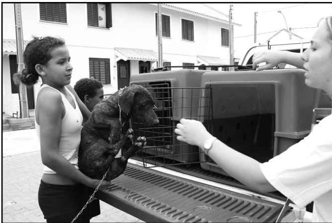
Ideia é qualificar o atendimento, especialmente em vilas da Capital

nosso trabalho terá um resultado a médio e longo prazo. A doação é um pontapé inicial para melhorar a qualidade de vida dos animais das comunidades”, frisou ela.