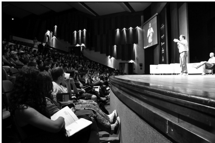
A era da conectividade foi tema do último encontro do ano

longo de sua história, a humanidade desenvolveu diversas formas de registro, desde os documentos gravados em pedra e, mais tarde, a invenção da escrita, até o desenvolvimento da tecnologia da informática, que é a forma avançada de comunicação.