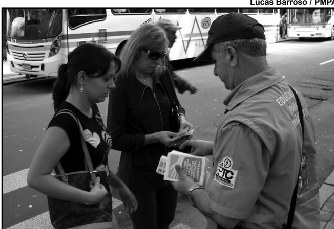
Noventa agentes da EPTC em ação pelo respeito à faixa

As atividades ocorrerão de quarta-feira a sexta-feira, das 9h30 às 11h30 e das 14h30 às 16h30, nos seguintes locais: Paulino Chaves, em frente ao Colégio Nossa Senhora do Brasil; Caldas Júnior, esquina Sete de Setembro; Lima e Silva, esquina João Neves da Fontoura (Escola Renascença); Marcílio Dias, em frente à Escola Nossa Senhora de Lourdes; Silveiro, esquina Barão do Cerro Largo (perto da Escola Euclides da Cunha); Borges de Medeiros (próximo à prefeitura); José de Alencar, 998 e Marechal José Inácio da Silva, próximo do Instituto Maria Auxiliadora.