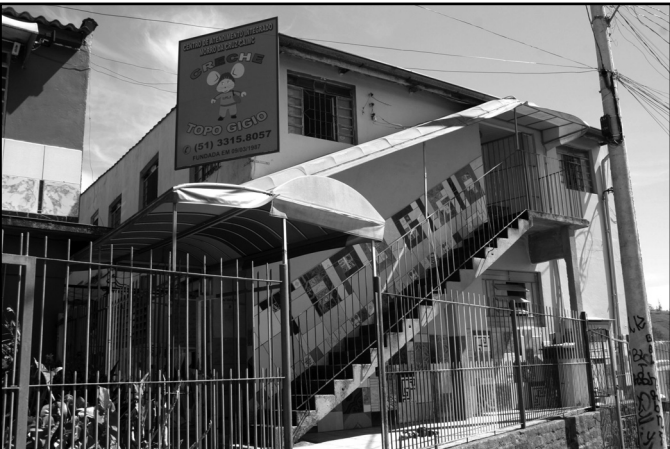
Creche Topo Gigio faz parte do roteiro

O prefeito e os secretários municipais irão hoje, 10, à Região Partenon do Orçamento Participativo (OP), dentro do projeto Prefeitura na Comunidade. A 12ª visita da iniciativa abrange os bairros Cel. Aparício Borges, Partenon, Santo Antônio, São José e Vila João Pessoa. O roteiro terá início às 9h, com a saída do ônibus do OP do Paço Municipal.