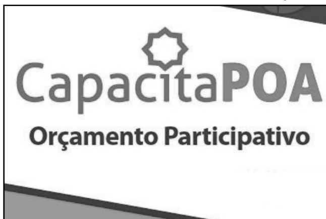
CapacitaPOA conta com cartilhas sobre nove temas

Realização - O CapacitaPOA é uma realização da prefeitura, por meio da Secretaria Municipal de Coordenação Política e Governança Local e Escola de Gestão Pública/SMA, e conta com a parceria do Sistema de Planejamento e Gestão Local Participativa (PGLP), cuja metodologia é aplicada na capacitação.