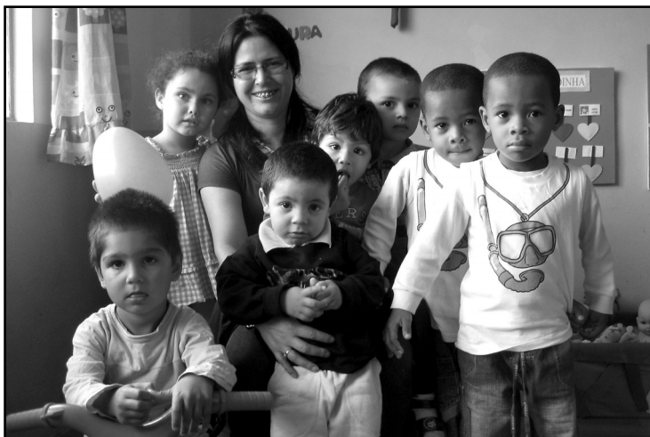
Porto Alegre é considerada uma das cidades do país mais avançadas no tema

Porto Alegre é considerada uma das cidades brasileiras mais avançadas no tema. Entre as ações que diferenciam o trabalho da Capital está o CMDCA e a existência do Fundo Municipal dos Direitos da Criança e do Adolescente (Funcriança), que desde 1991 financia projetos de promoção e defesa dos direitos de crianças e adolescentes. Esse fundo é composto por doações de pessoas físicas e jurídicas, dedutíveis do imposto de renda, de acordo com o artigo 260 do Estatuto da Criança e do Adolescente (Lei Federal nº 8.069, de 13/07/90), além de recursos da prefeitura.