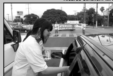
Ações educativas contribuíram para redução de acidentes

Desde que foram instalados os novos 22 pontos de pardais na cidade e intensificados o uso do Radar Móvel e as blitzes com apoio da Brigada Milit-