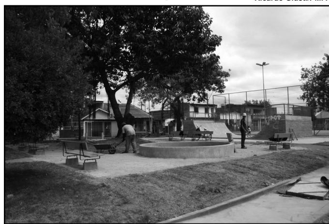
Vila Farrapos: 25 praças integradas ao Picc receberam novos equipamentos

Qualificação da Saúde - Durante o roteiro, o prefeito assinou a ordem de início das obras da nova Unidade de Saúde da Família (UBS Farrapos), definida pela comunidade por intermédio do OP, onde serão implantadas duas novas equipes de saúde e uma equipe de saúde bucal. O prefeito destacou que a unidade soma-se à obra da base Samu Frederico Mentz, localizada ao lado, que está sendo concluída neste ano.