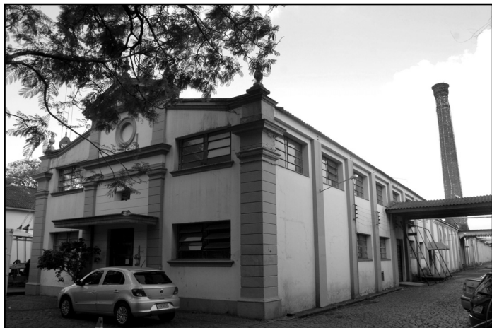
Região concentra primeiras instalações fabris da Capital