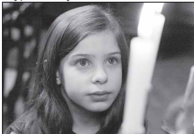
Masángeles, filme uruguaio de Beatriz Flores Silva

A Sala P. F. Gastal da Usina do Gasômetro está integrada ao circuito que realiza a mostra O Melhor do Input 2009, também formado pelo Instituto Goethe e pelo CineBancários. A mostra reúne uma seleção com alguns dos melhores programas produzidos pela TV mundial ao longo da última temporada. Toda a programação tem entrada franca, e os filmes são legendados em português. Mais informações em www.salapfgastal.blogspot.com