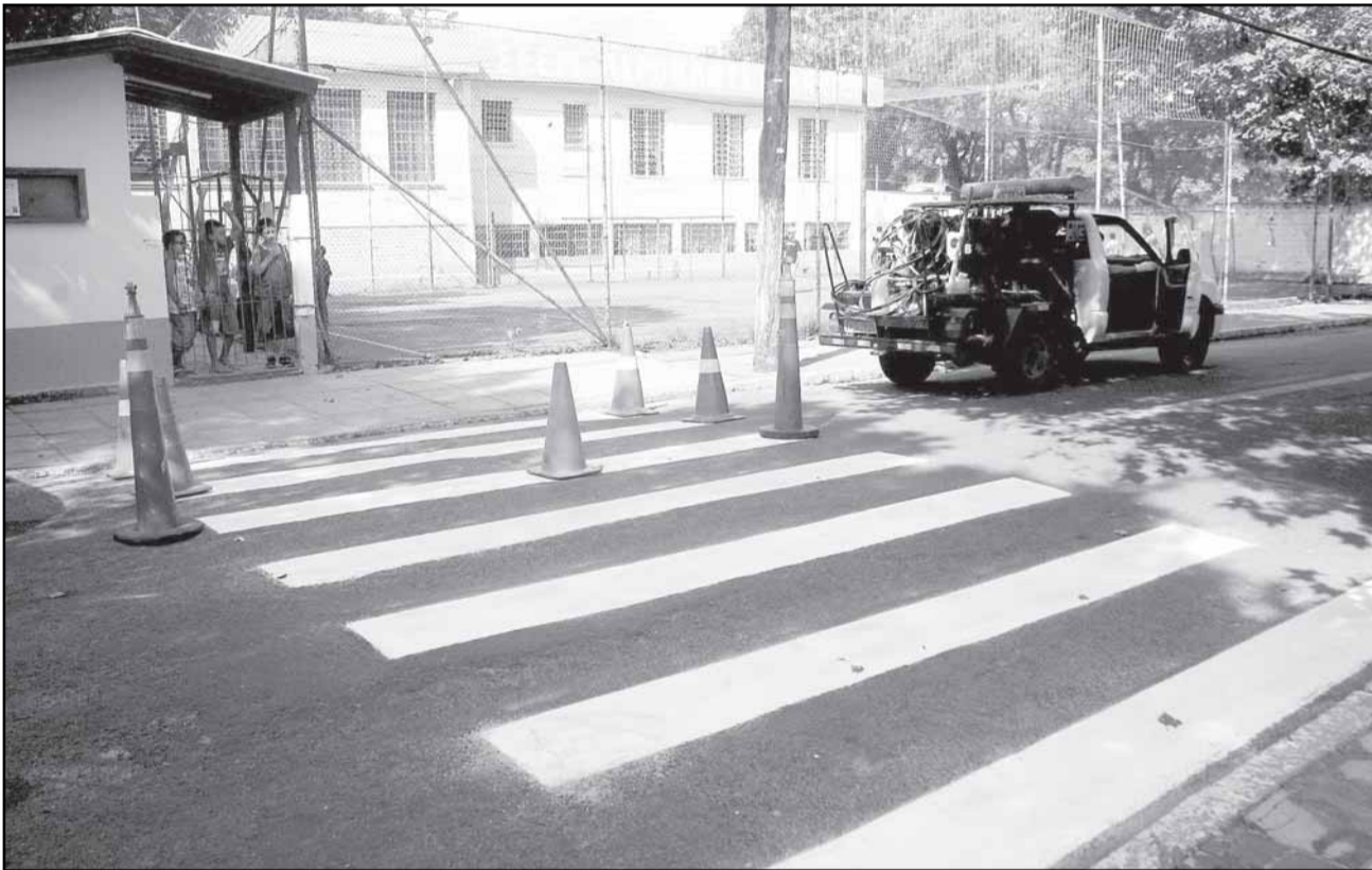
Disque Faixa recebeu 278 ligações e EPTC já revitalizou 198 faixas