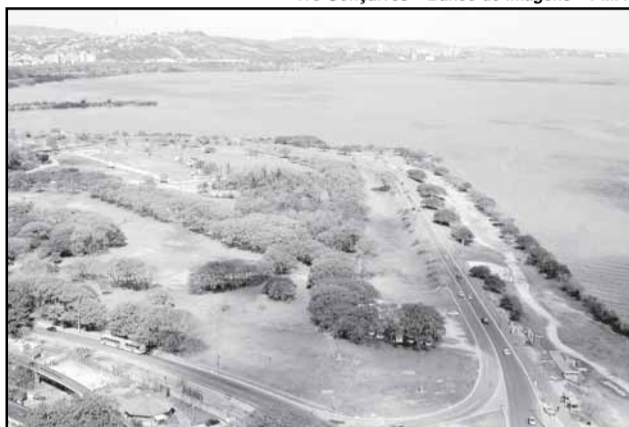
Lago Guaíba ganhará um abraço simbólico no último dia do seminário

No sábado, último dia, acontece a Procissão das Águas – Eu sou o Guaíba, com saída às 8h de vários pontos do Arroio