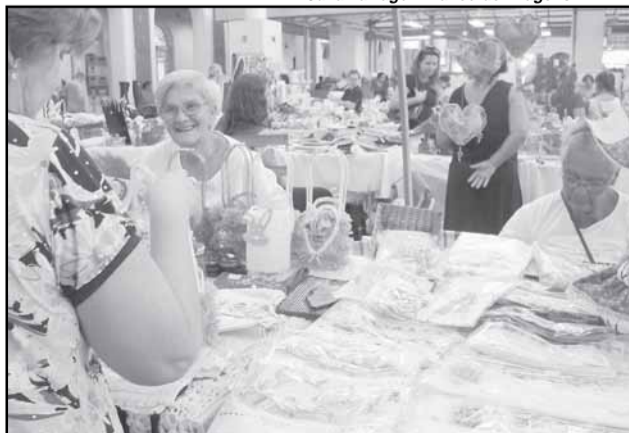
Artesãs expõem trabalho desenvolvido em cinco escolas municipais