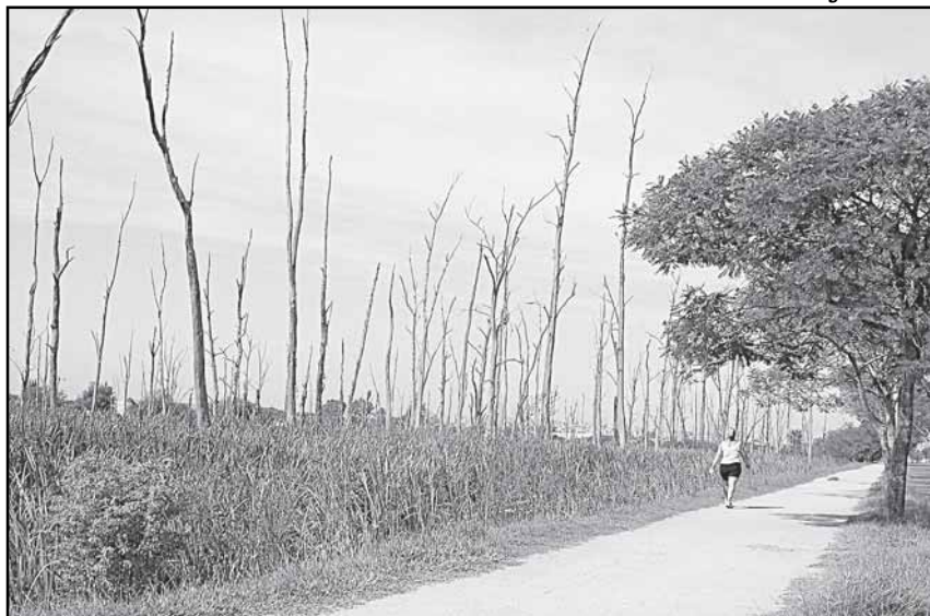
A empresa contratada terá o prazo de 150 dias para conclusão dos serviços