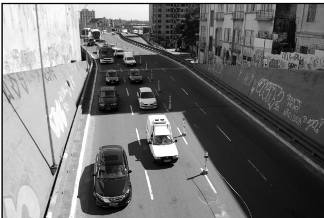
Pico da manhã passou no teste, sem registro de congestionamentos

na, o resultado das mudanças é positivo. “Aos poucos, acontece o equilíbrio na ocupação dos espaços, em rotas alternativas. Mas a primeira avaliação é positiva, sem maiores conflitos”, afirmou. Os cerca de cem agentes da EPTC presentes na área prosseguem com orientações aos motoristas sobre as mudanças.