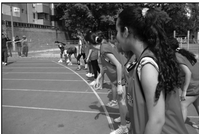
Jogos devem mobilizar 6 mil alunos

Os jogos são divididos entre recreativos e competitivos. Os recreativos têm como objetivo integrar os jovens, sem competições, e desenvolvem oficinas, brincadeiras e atletismo, em que todos os participantes recebem prêmios. Os competitivos estimulam a superação e incluem as modalidades de basquete, handebol, futsal e vôlei. Nesse caso, são premiados os que ficam entre o 1º e o 4º lugares. As escolas com maior número de participantes também são premiadas.