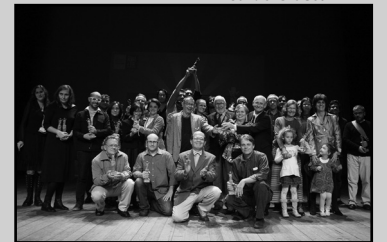
Açorianos premia em categorias como pintura, escultura, desenho, cerâmica, gravura e mídias tecnológicas