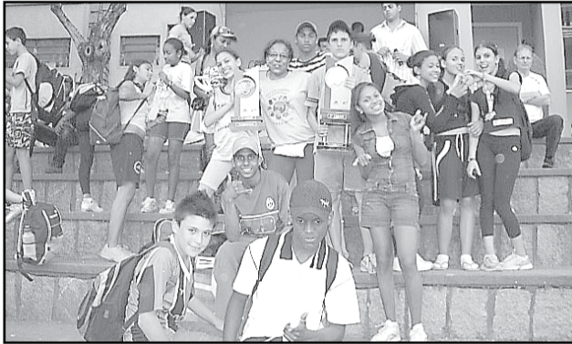
Estudantes da escola João Satte comemoram conquistas na Sogipa