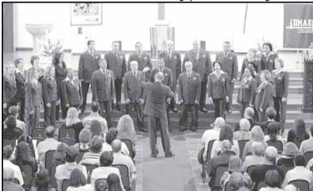
Festival de Coros teve a participação de grupos convidados