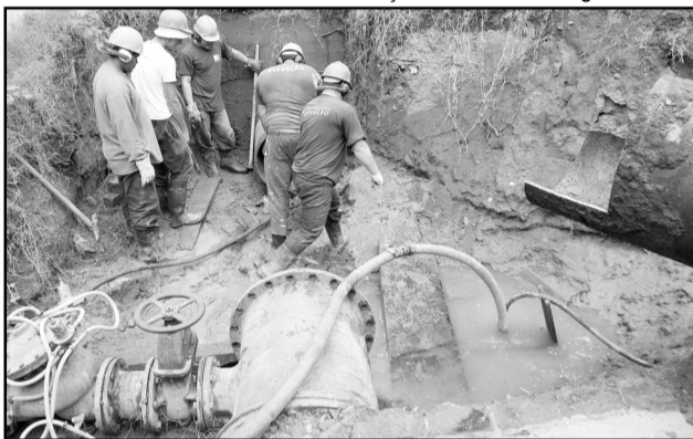
Conjunto de obras vai gerar acréscimo de 27% na produção de água do sistema Tristeza

Tapa Buracos, que aplica um asfalto derivado do pré-misturado a frio, permitindo a realização dos trabalhos em dias chuvosos. Atualmente, a Smov conta apenas com um veículo, mas existe um edital publicado para a contratação de mais três vans. Neste ano, foram aplicadas 37,5 toneladas de asfalto frio, em 688 metros quadrados de via.