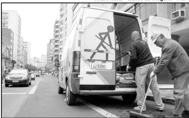
Neste ano foram aplicadas 37,5 toneladas de asfalto frio em 688 m² de via