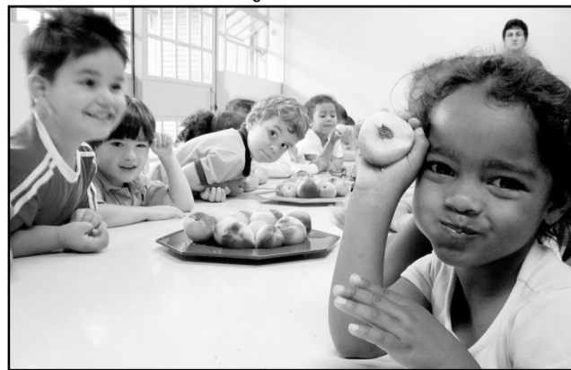
Porto Alegre foi indicada duas vezes para prêmio nacional de alimentação escolar