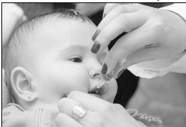
A gotinha é indicada para crianças de zero a cinco anos

público, rodoviária, e praças da capital, além de toda a rede de serviços de saúde. As Unidades Básicas de Saúde (UBS) estarão abertas até 18h, e as Equipes de Saúde da Família (PSF) e postos volantes, até 17h.