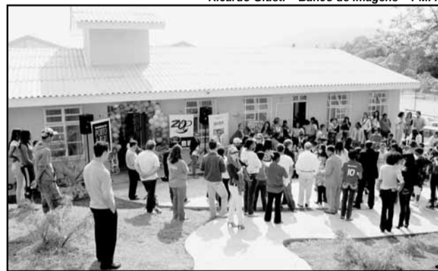
A Escola Infantil São Guilherme é resultado de ação de governança solidária entre prefeitura, Capa Engenharia e comunidade

O gesto de estender o braço não é uma lei de trânsito. Mas o respeito à faixa de pedestre é lei, Artigo 214 do Código de Trânsito Brasileiro (CTB). O não cumprimento resulta em sete pontos na Carteira de Motorista, é multa gravíssima, com valor de R$191,54.