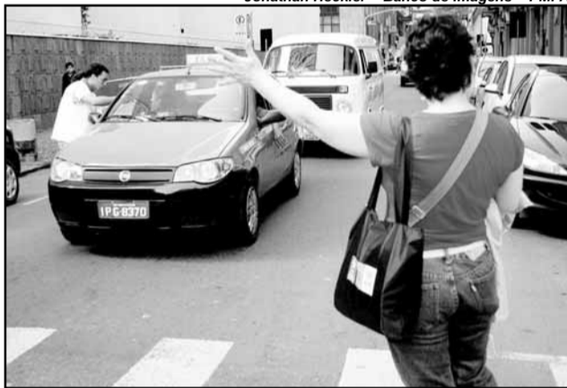
Pedestres devem estender bem o braço e esperar os carros pararem