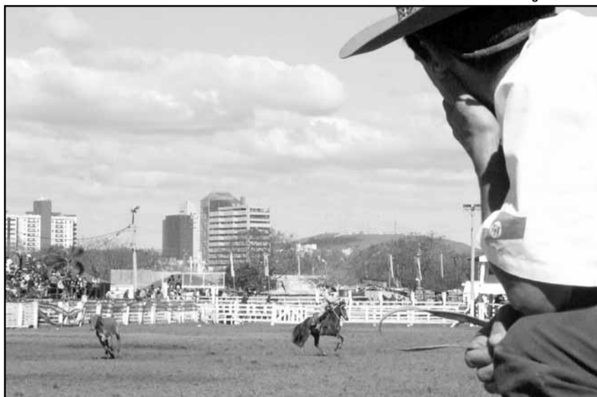
Competições serão na Fazendinha do Parque a partir das 8h

O Rodeio Farroupilha prevê ainda outras provas: Laços Senhor; Piá; Guri; Prenda; Vaqueano; Veterano; Pai e Fi-