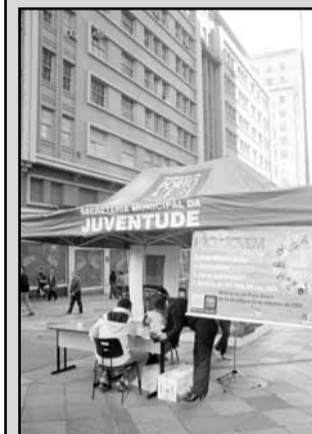
Jonathan Heckler – Banco de Imagens – PMPA

Os alunos matriculados que não entregaram toda a documentação que procurem a SMJ. Para se inscrever, é necessário carteira de identidade, comprovante de residência em Porto Alegre e histórico escolar, se tiver.