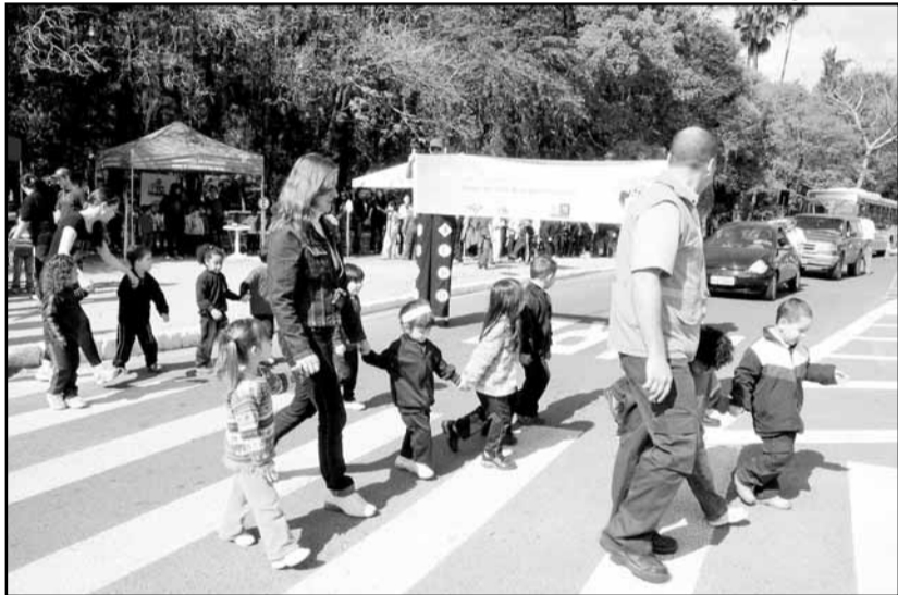
Alunos recebem orientações para travessia segura nas faixas