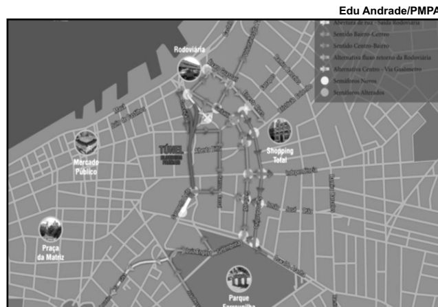
Sentido das ruas Garibaldi e Santo Antônio será invertido

O que muda no trânsito - A EPTC está implementando rotas alternativas para chegar e sair do Centro. Dentre as principais mudanças estão a inversão de sentido das ruas Garibaldi e Santo Antônio, abertura de nova via para circulação dos táxis que saem da rodoviária, permissão da conversão na av. Loureiro da Silva dos veículos que se deslocam pela av. João Pessoa no sentido bairro-centro e possibilidade de cruzamento da av. Farrapos pela Rua Ernesto Alves.