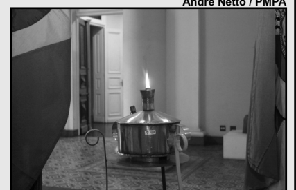
Centelha será acesa na Redenção

A chama será conduzida por corredores da Empresa Brasileira de Correios e Telégrafos e da Brigada Militar. Às 9h, no Monumento ao Expedicionário