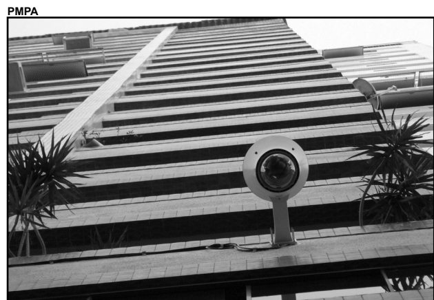
Rede possibilita implantação de câmeras de segurança

P ara unir 15 instituições de ensino em 86 quilômetros de fibras ópticas, foi inaugurada ontem, 31, a Rede Metropolitana de Porto Alegre (MetroPOA). Junto com a Infovia Procempa, a nova infraestrutura vai garantir uma rede digital de quase 600 quilômetros na cidade e a ampliação de serviços públicos, como videomonitoramento e conexão a postos de saúde.