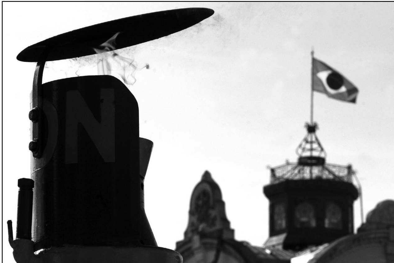
Após percorrer 220 cidades e iluminar o Paço Municipal, o Fogo Simbólico é aceso na Redenção