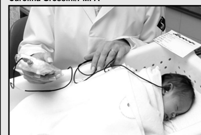
Em média, teste é feito em 200 bebês todos os meses

orelhinha do bebê como um fone de ouvido. A sonda emite um som e capta a resposta ao estímulo no ouvido, indicando, então, se há algum tipo de problema na audição.