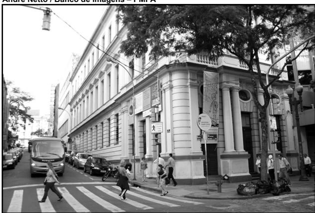
Prédio foi construído em 1922

Obra de restauração do Museu de Comunicação Social Hipólito José da Costa, realizada por meio do Projeto Monumenta, será entregue hoje, 2, às 19h, em cerimônia naquele prédio (rua dos Andradas, 959, Centro Histórico). A ação foi executada pela Secretaria Municipal da Cultura em convênio com a Secretaria de Estado da Cultura e o Governo Federal.