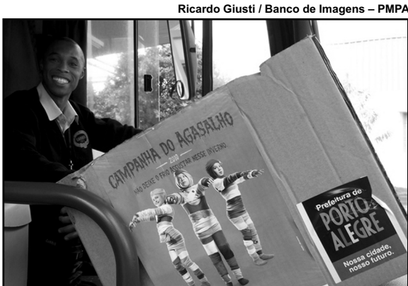
Na comparação com 2009, houve aumento de 60% nas arrecadações

Entidades beneficiadas - Abrigos e Albergues Municipais, Centros de Atendimento Regionais (Restinga, Lomba do Pinheiro, Bom Jesus), Casas de Passagem, Casas de Acolhimento, Casas Especiais, Fazendas Terapêuticas (conveniadas), Conselhos Tutelares, Associações de Moradores, Creches Municipais, Hospital Materno Infantil Presidente Vargas, entre outros.