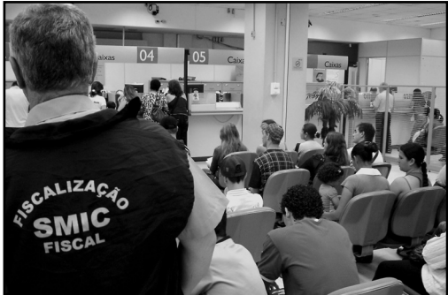
Legenda: Espera em bancos não pode ser superior a 15 minutos em dias normais