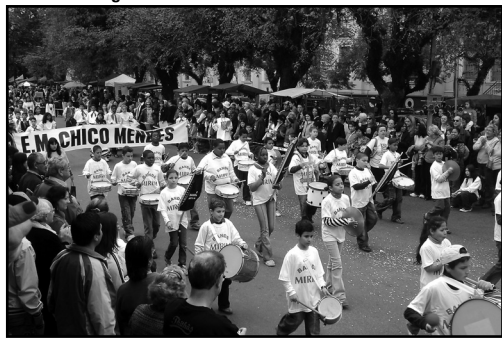
Evento terá a participação de estudantes das redes municipal, estadual e privada

Ocorre sexta-feira, 3, o Desfile da Semana da Pátria na Restinga. Realizado desde 2003, o ato cívico tem início a partir das 8h30 na Esplanada da Restinga (Estrada João Antônio da Silveira, s/nº). O evento terá a participação de escolas das redes municipal, estadual e privada, além de creches e instituições conveniadas à Secretaria Municipal de Educação (Smed).