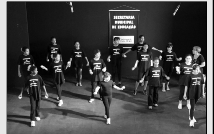
Alessandro Oliveri / PMPA

Já é tempo de se preparar para a programação da 56ª Feira do Livro de Porto Alegre. Estão abertas as inscrições para o 3º Seminário A arte de contar histórias, que revelará a profissionais, estudantes e amantes da literatura como