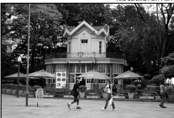
Ana Carolina Pan / PMPA

As obras começaram nesta semana. A primeira etapa vai permitir a liberação do 2º pavimento do Chalé com a retirada da cozinha, que vai para o térreo, e possibilitar que o terraço seja um salão privilegiado, o que significa, também, a redução do risco de incêndio para o prédio, que é tombado pelo Patrimônio Histórico e Cultural. Ao lado do prédio atual, será criado um salão de vidro com capacidade para 250 pessoas. A ampliação do Chalé faz parte da primeira etapa do programa de reurbanização da Praça XV, Largo Glênio Peres e das ruas Marechal Floriano e José Montauray pelo Projeto Viva o Centro. O investimento é de cerca de R$ 1,5 milhão, e a previsão de entrega é de 90 dias.