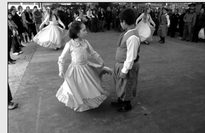
Programação é rica em informações culturais e costumes do gaúcho