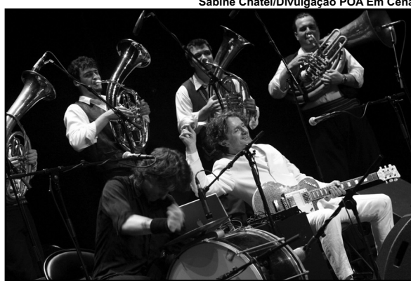
Weddings and Funerals Orchestra faz show no Bourbon Country