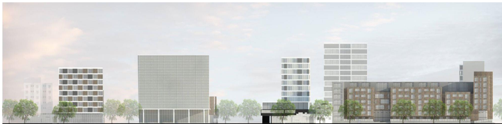
ELEVAÇÃO RUA SANTOS DUMONT