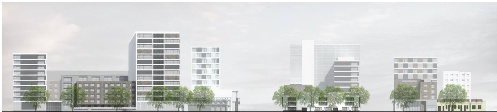
ELEVAÇÃO AVENIDA SÃO PAULO