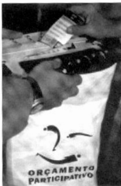
Conselho do Orçamento Participativo

O Orçamento Participativo esta acima de governos. Muito já foi feito tendo como base a voz, a indignação, a cultura à memória e principalmente a atitude de nosso povo.