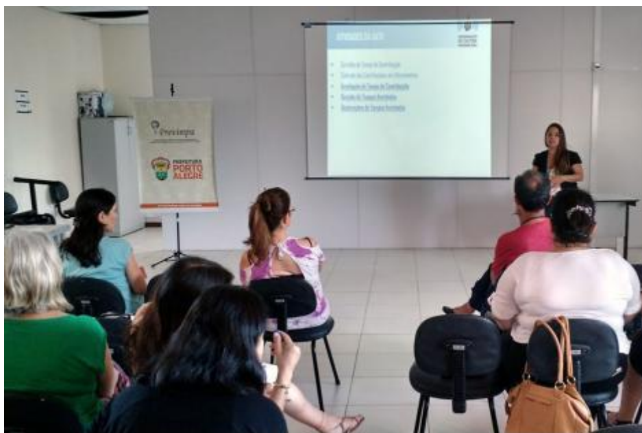
Figura 4: Disseminação da Cultura Previdenciária.

O contato direto com os técnicos responsáveis pela gestão dos benefícios previdenciários oferecidos pela PMPA oportuniza aos segurados do Previmpa o esclarecimento de dúvidas que podem ter impacto direto na vida funcional e no processo de aposentadoria dos servidores.