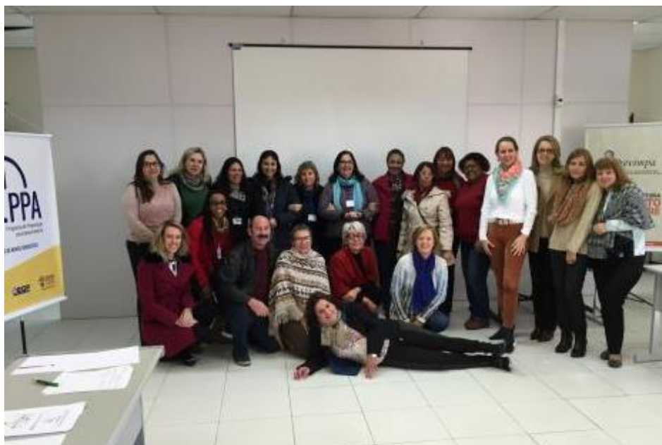
Figura 3: Primeira turma do PPA em 2016.

Em parceria com a Escola de Gestão da PMPA, o Previmpa promoveu quatro turmas do curso de Preparação para Aposentadoria dos Servidores Municipais no ano de 2016. A programação permanente do programa inclui nove encontros, realizados duas vezes por semana, perfazendo um total de 36 horas, no período de cinco semanas.