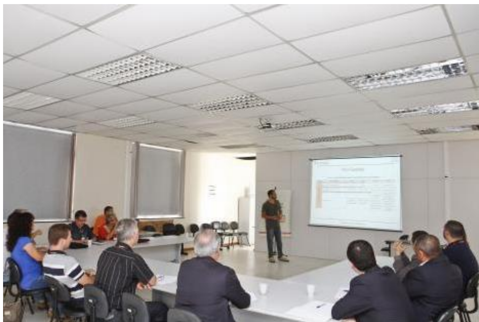
Figura 5: Reunião Técnica na sede do Departamento.

O Comitê de Investimentos é formado por 10 representantes dos servidores e reúne-se de forma ordinária quinzenalmente, tendo entre suas atribuições acompanhar de forma permanente a política de investimentos do departamento. De acordo com o Pró-gestão, Programa de Modernização Administrativa do Ministério da Previdência Social, todos os RPPS do país deverão ter seus comitês de investimentos em pleno funcionamento até o dia primeiro de janeiro de 2017.