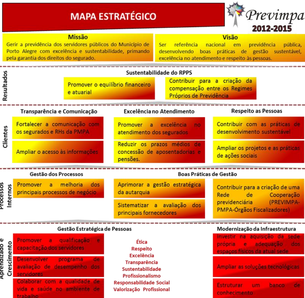
Figura 2: Mapa Estratégico do Previmpa.

Negócio - Administrando o presente e assegurando o futuro.