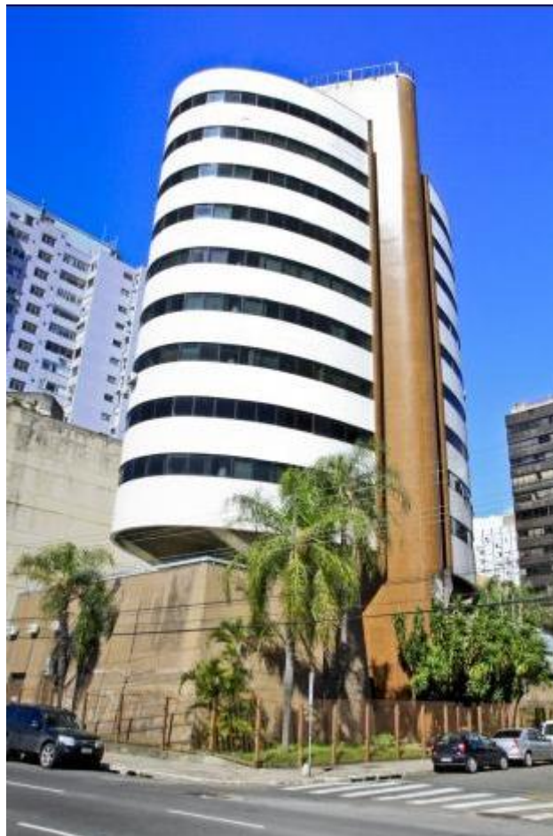
Figura 7: Nova sede do Previmpa.

O Previmpa finalizou uma etapa imprescindível em direção à ocupação da sua nova sede: entregou à Secretaria da Fazenda os projetos técnicos necessários para a abertura do processo de contratação do serviço de reforma predial das futuras instalações da autarquia.