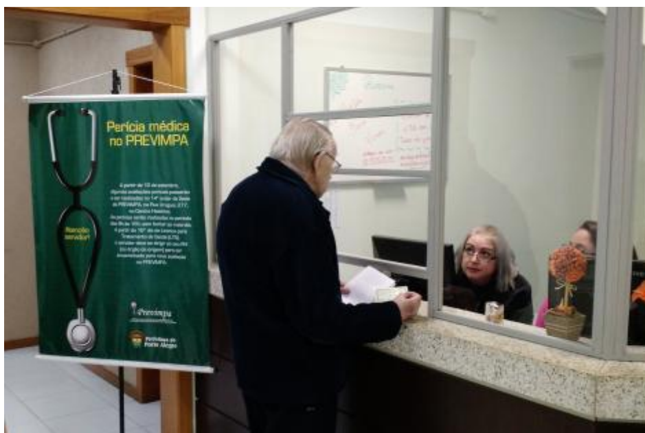
Figura 6: Recepção da UMPP.