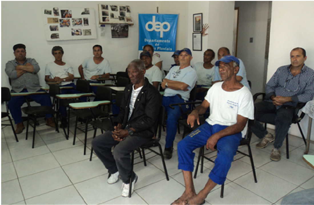
Foto 02: Equipe da Fábrica de Artefatos, Almoxarifado e Manutenção.