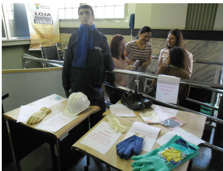
Foto 4: Equipamentos de Proteção Individual – EPIs Ação Educativa Semana do Servidor 2013 (31/10).