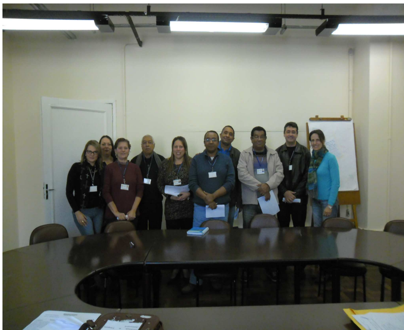
Foto 1: Reunião de apuração dos resultados das Eleições CSST/SMA com a presença de membros da Comissão Eleitoral e de candidatas ao pleito (11/06/13).

O empenho da Comissão Eleitoral traduziu-se nos seguintes resultados: concorrentes 10 candidatos, visando ocupar as 06 vagas elegíveis (03 titulares e 03 suplentes). Dentre os 290 eleitores da SMA aptos a votar, compareceram 200 votantes (68,96%), o que representa um ótimo índice de participação. Foi publicado comunicado 7 dos resultados das eleições no DOPA - edição 4572, de 16 de agosto de 2013.