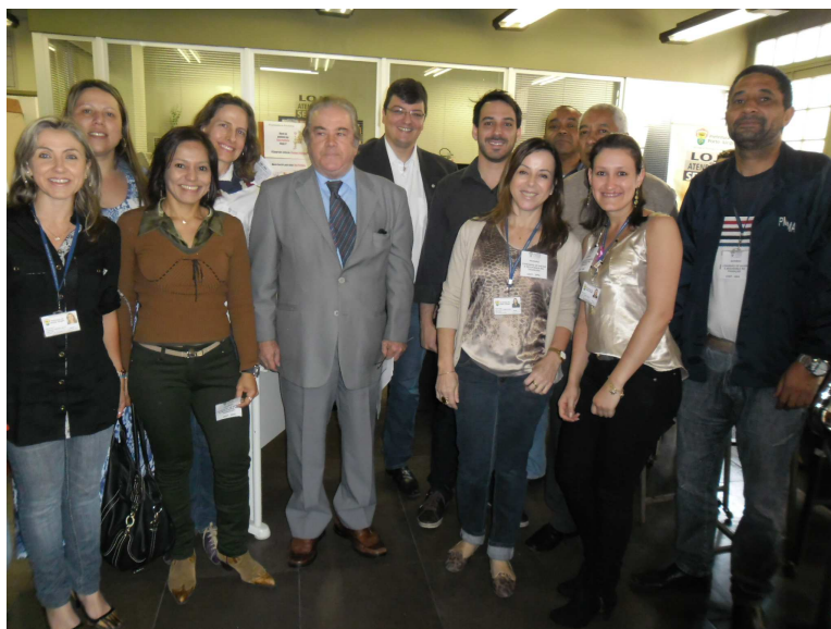
Foto 3: Membros da CSST/SMA com o Secretário Elói Guimarães e Secretário Adjunto Carlos Fett. Ação Educativa Semana do Servidor 2013 (31/10).