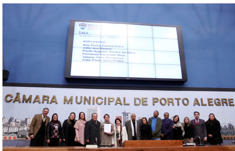
Foto 2: Posse coletiva (27/08).