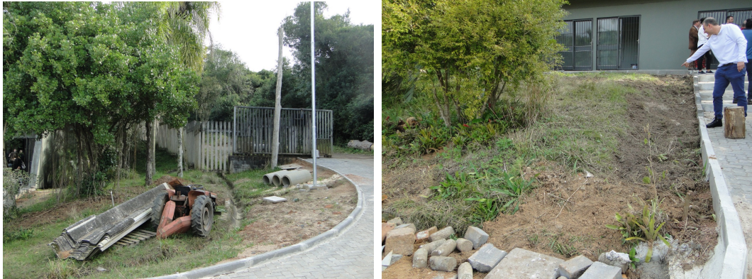
Canteiros 01 e 04 respectivamente

O material que será utilizado como aterro, já está dentro do canteiro de obras do Viveiro, portanto será removido para o correto local