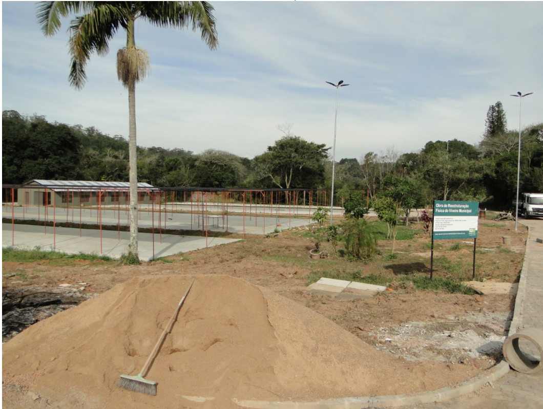
Canteiros 06 e 07