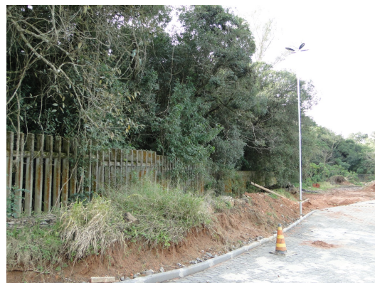
Exemplo dos canteiros que receberão plantio de Grama Catarina – C11 e C012