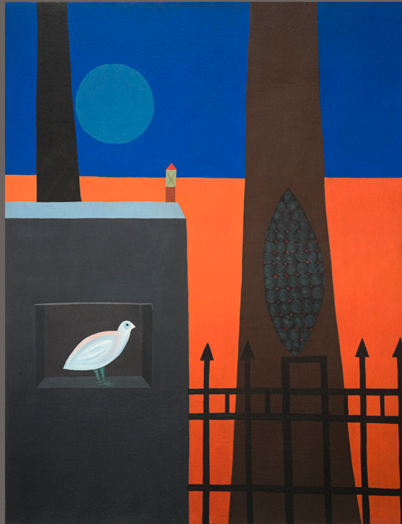
WALDENY ELIAS Fronteira I - 1968 óleo sobre tela