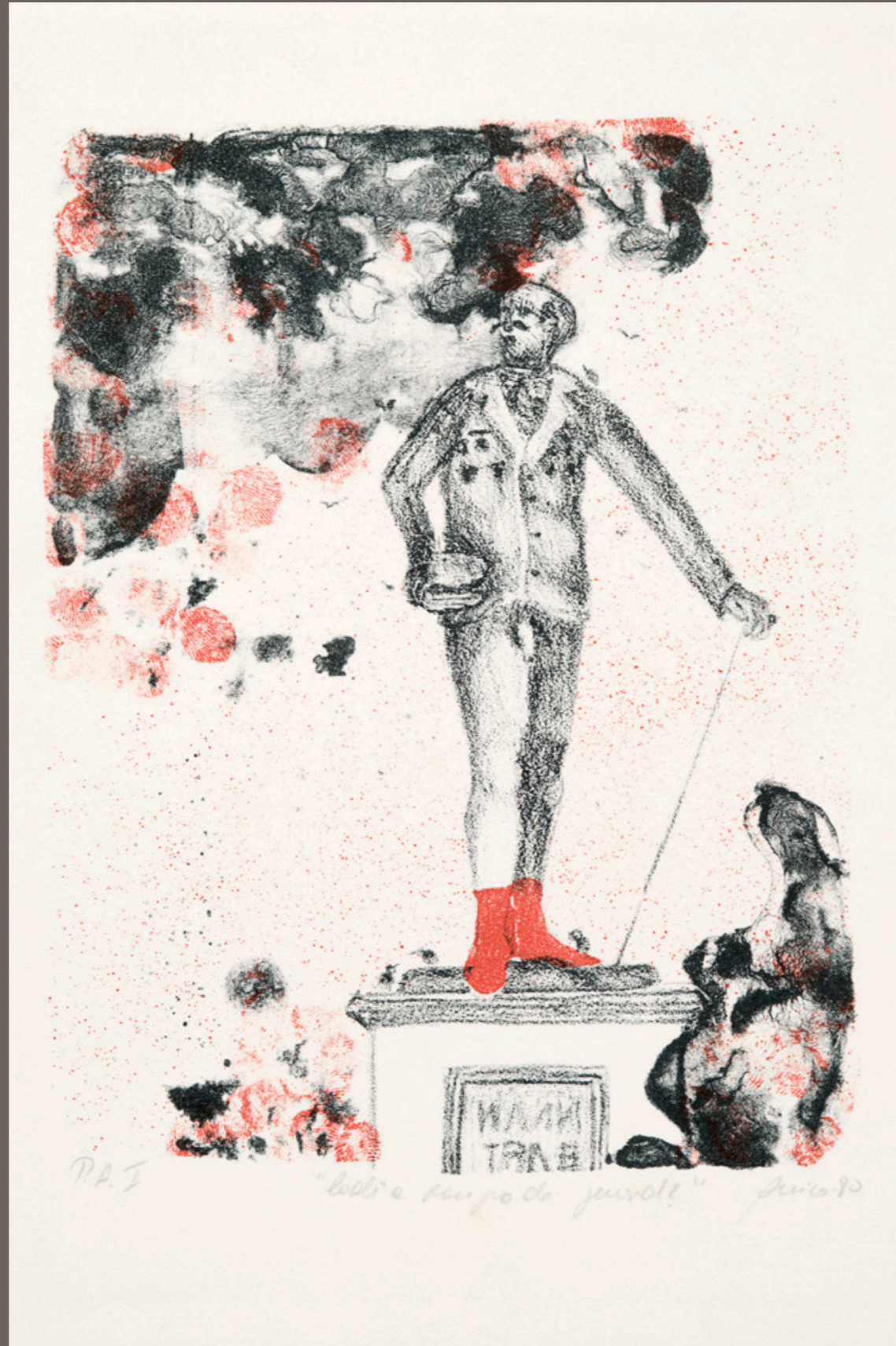
ANICO HERSKOVITS Cadê a roupa do general? - PA I - 1980 litografia