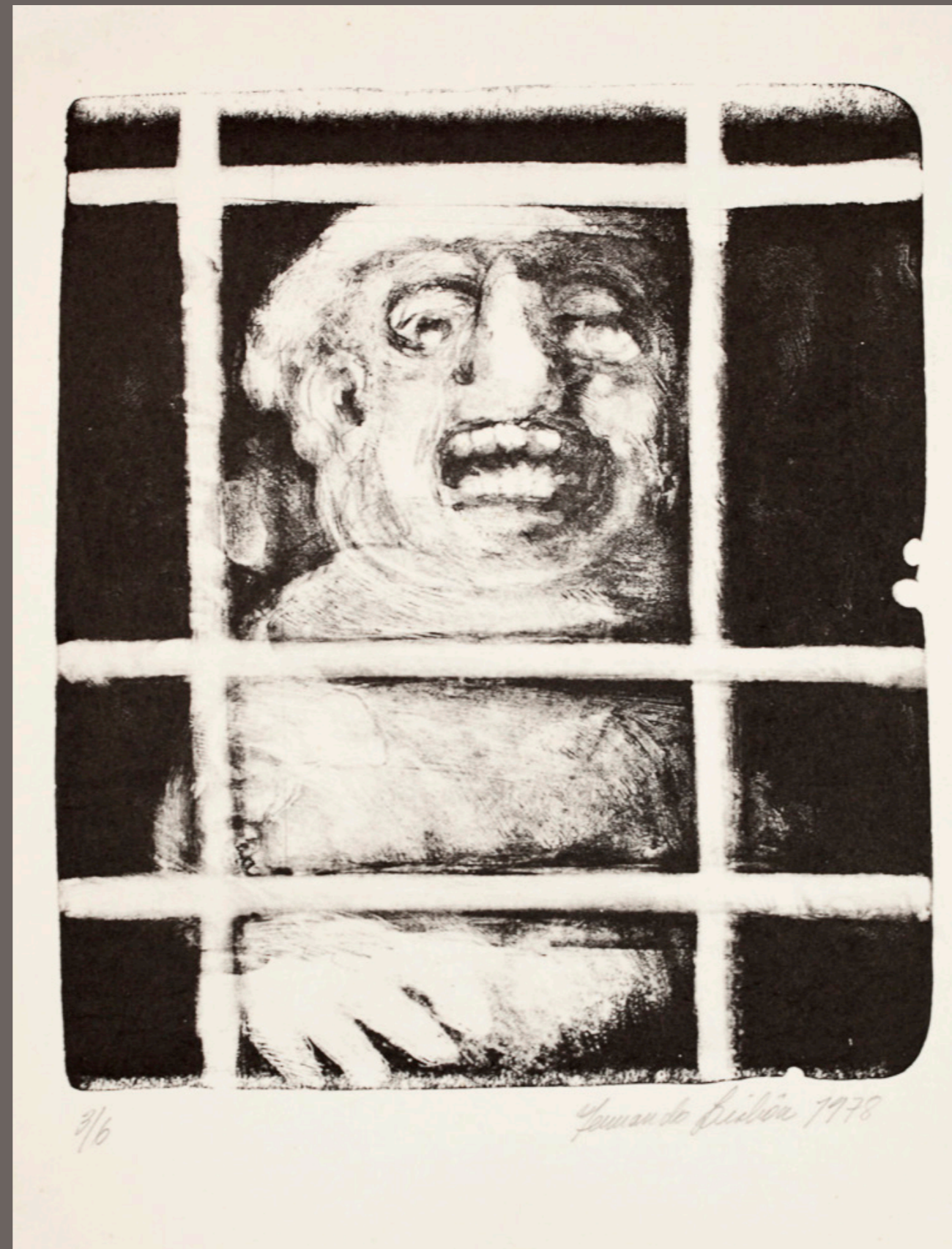
FERNANDO LISBÔA Sem título - 1978 litografia T 3/6