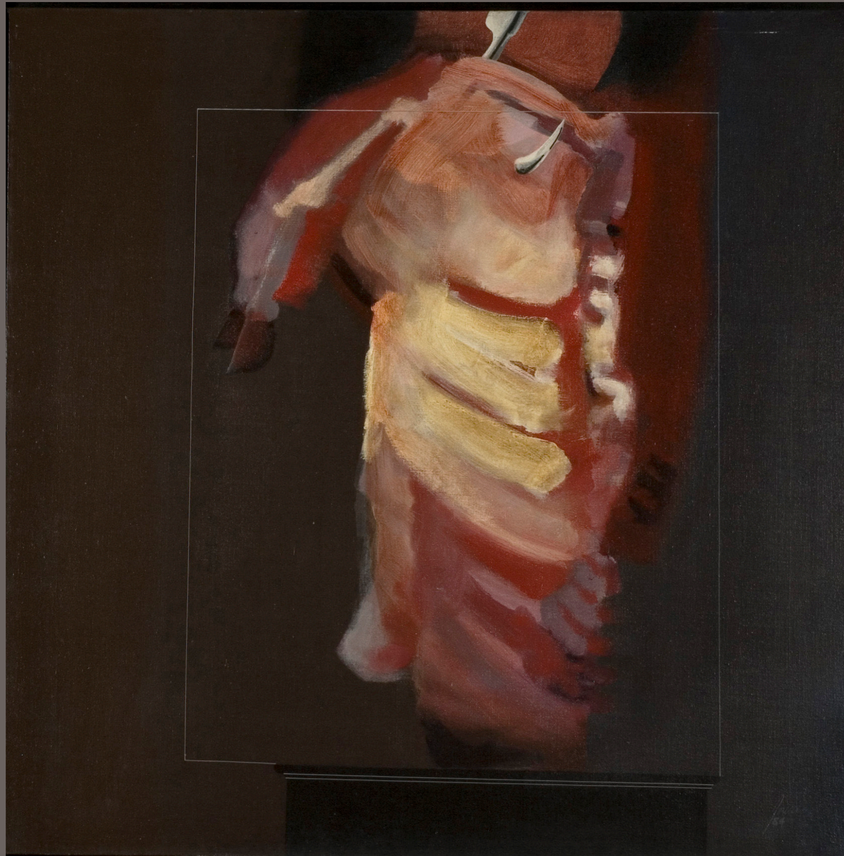
PAULO PORCELLA Sem título (da série “Vitrines”) - 1984 tinta acrílica sobre tela