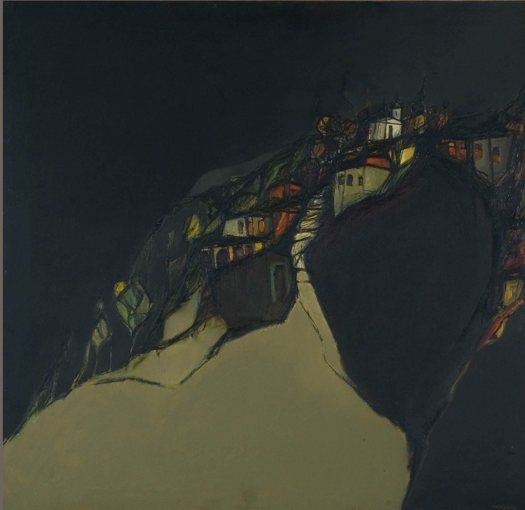
FERNANDO COELHO Favela - 1966 óleo sobre tela