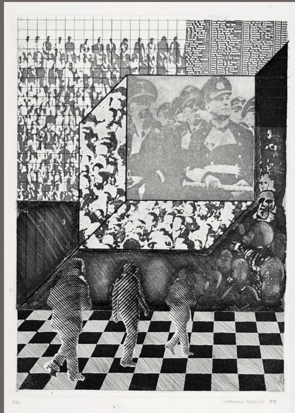
LEOPOLDO PIENTZ Sem título - PA - 1979 gravura em metal