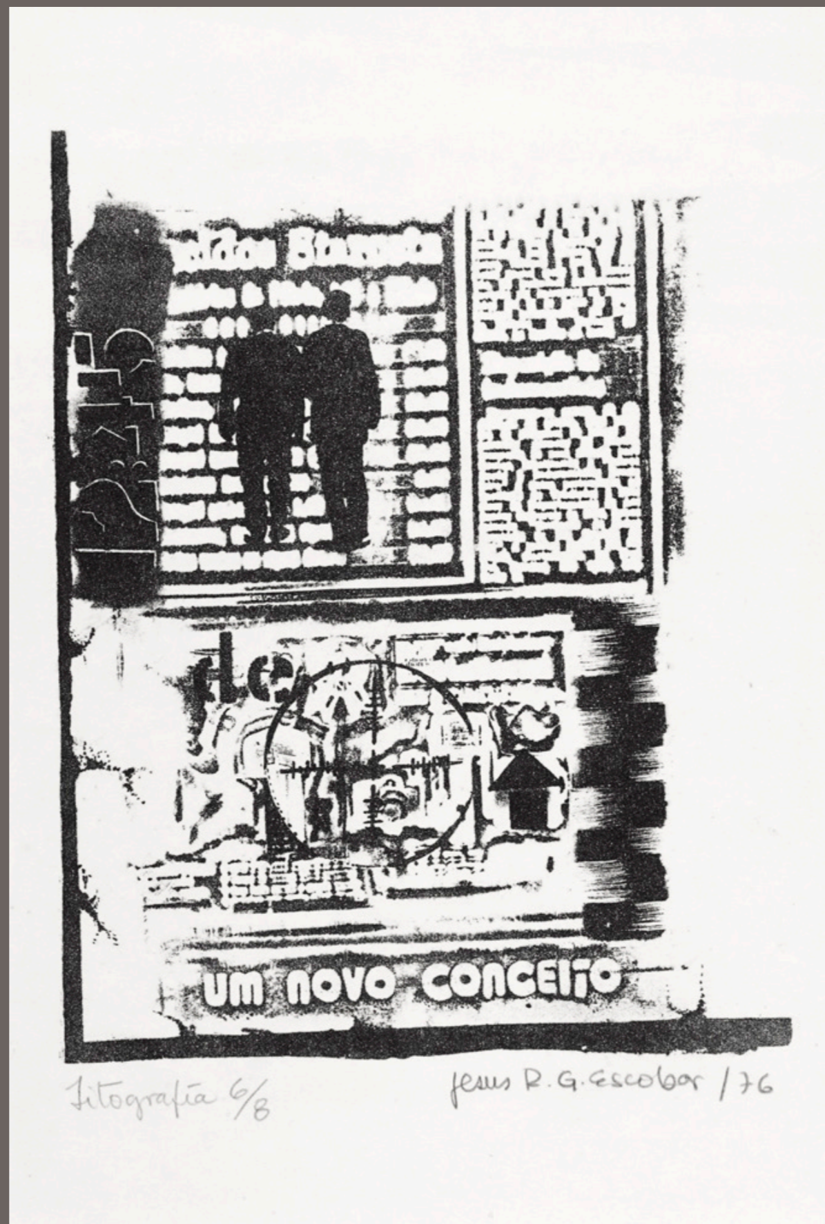
JESUS ESCOBAR Sem título - T 6/8 - 1976 litografia