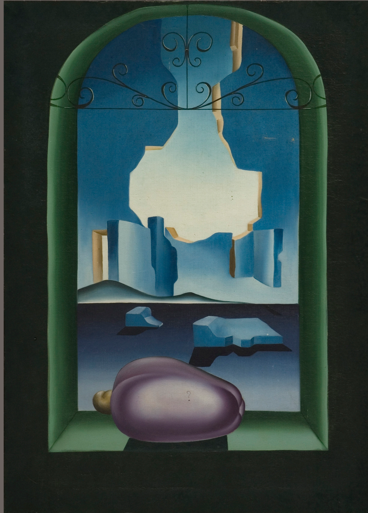
GERALDO OTACÍLIO ROCHA Composição com céu fragmentado - 1966 óleo sobre tela