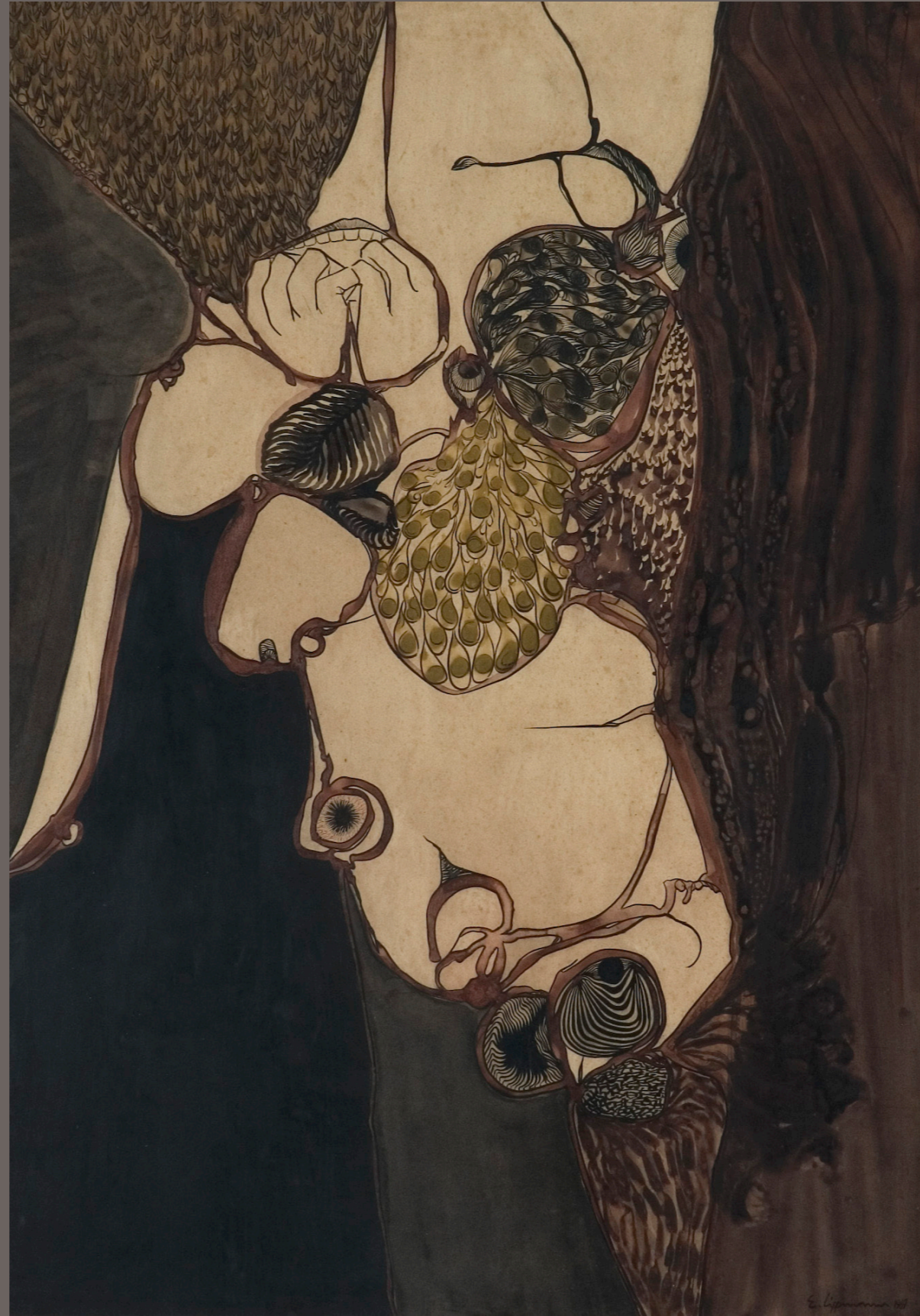
ÊNIO LIPPMANN Desenho VI - 1969 nanquim e aguada sobre papel