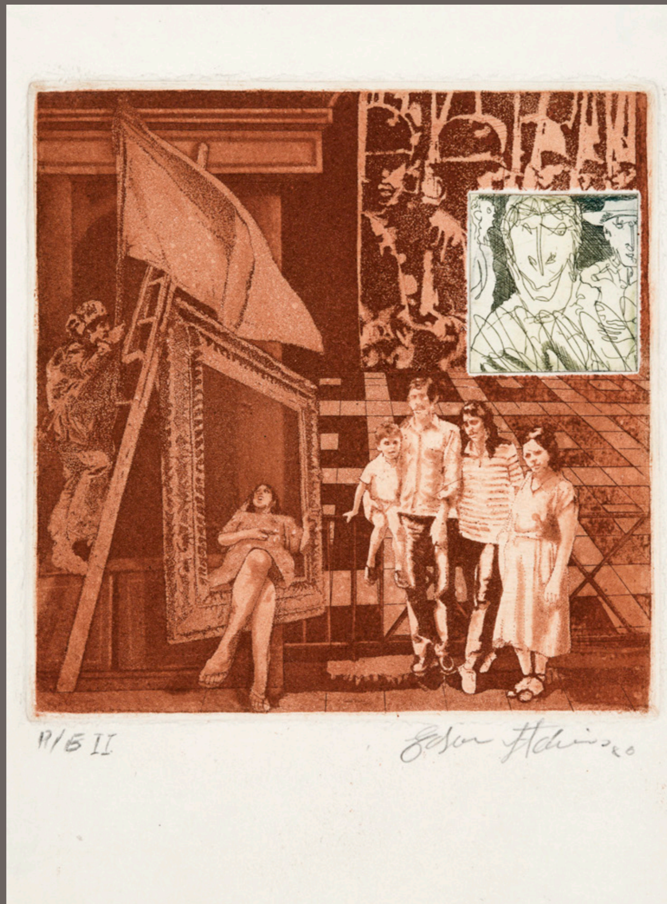
EDSON FLÁVIO PEREIRA Sem título - PE II - 1980 gravura em metal