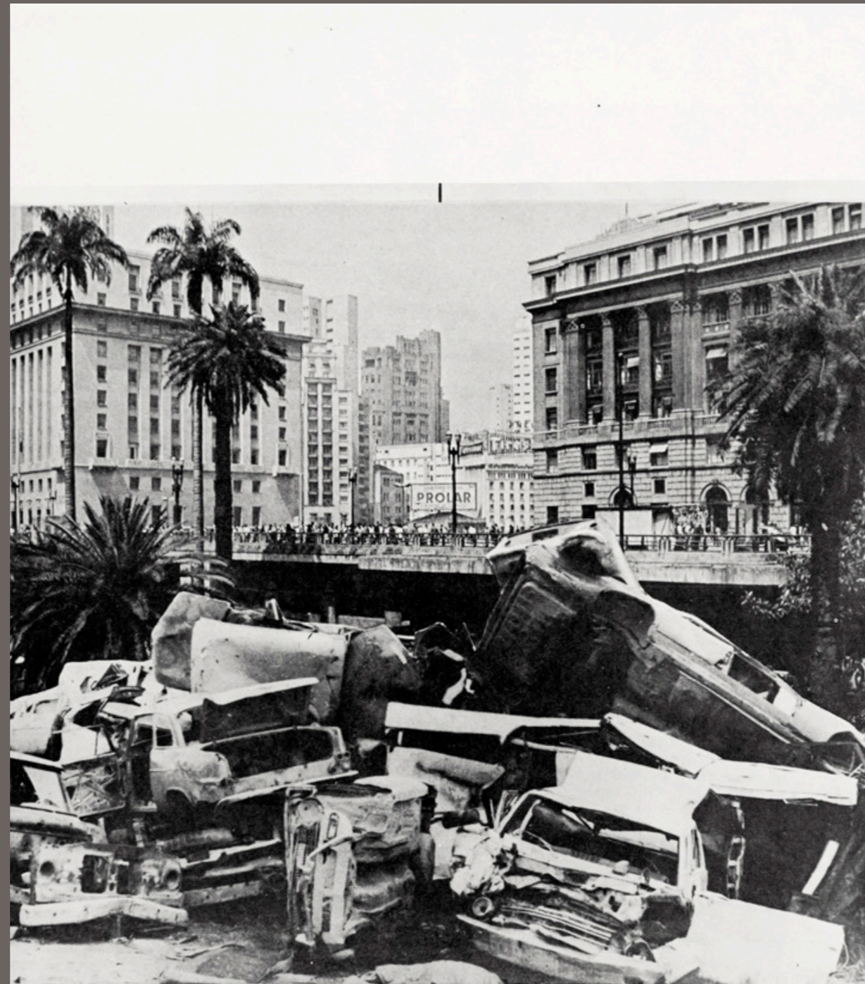
Brasil Turístico/SP/Viaduto do Chá/Regina Silveira/73

REGINA SILVEIRA Brasil Turístico/SP/Viaduto do Chá - 1973 xerografia