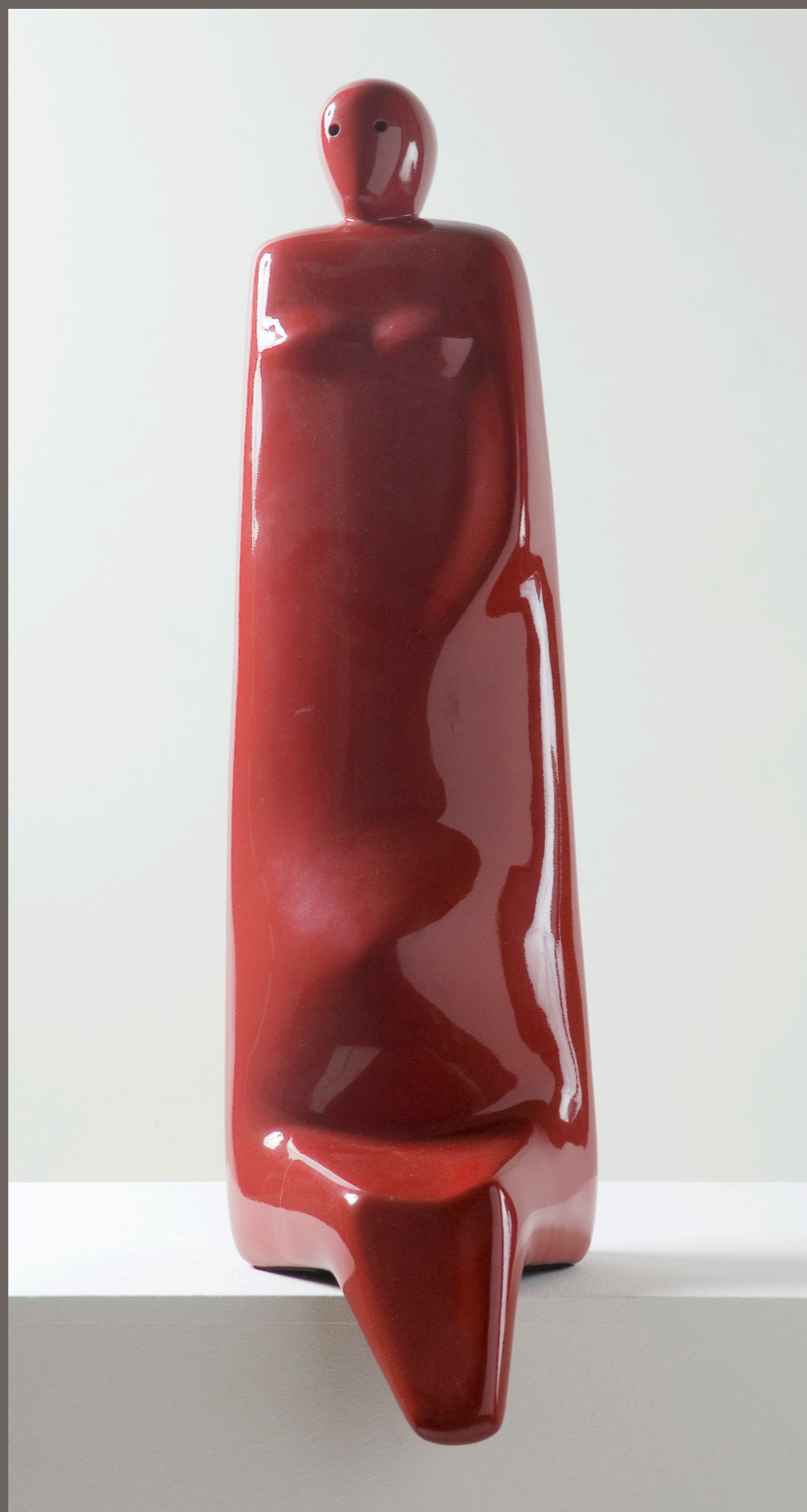
VASCO PRADO Esperança 72 - sem data alumínio pintado a duco