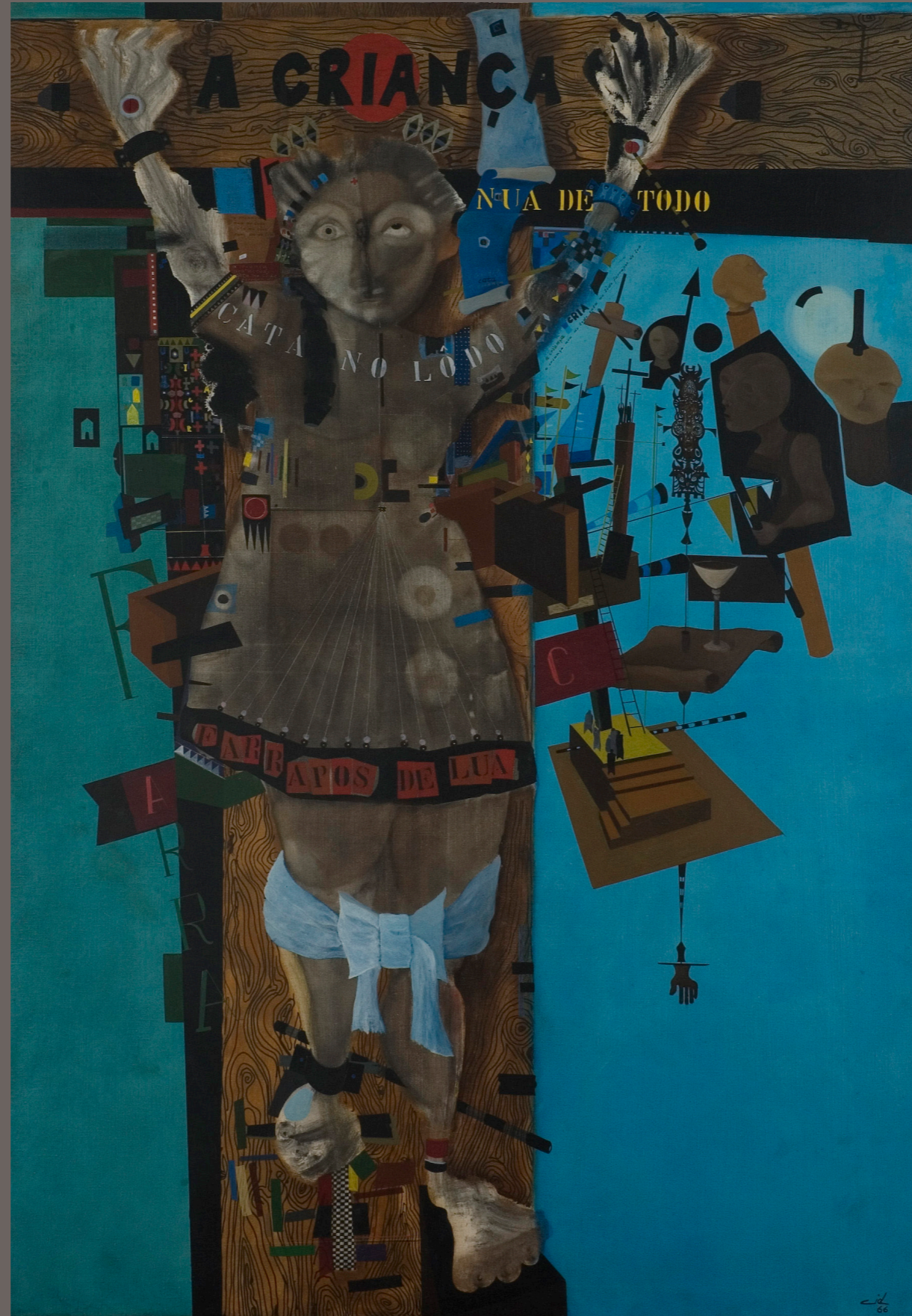
BERNARDO CID Composição - Criança Crucificada - 1966 óleo sobre tela