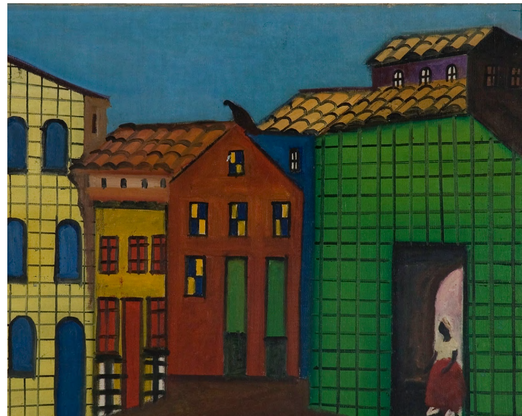
Bahia - 1965 óleo sobre tela - 50,0 x 61,2 cm Doação Diários e Emissoras Associados

Artes nos séculos. São Paulo: Abril Cultural, 1969. Enciclopédia Itaú Cultural de Artes Visuais.