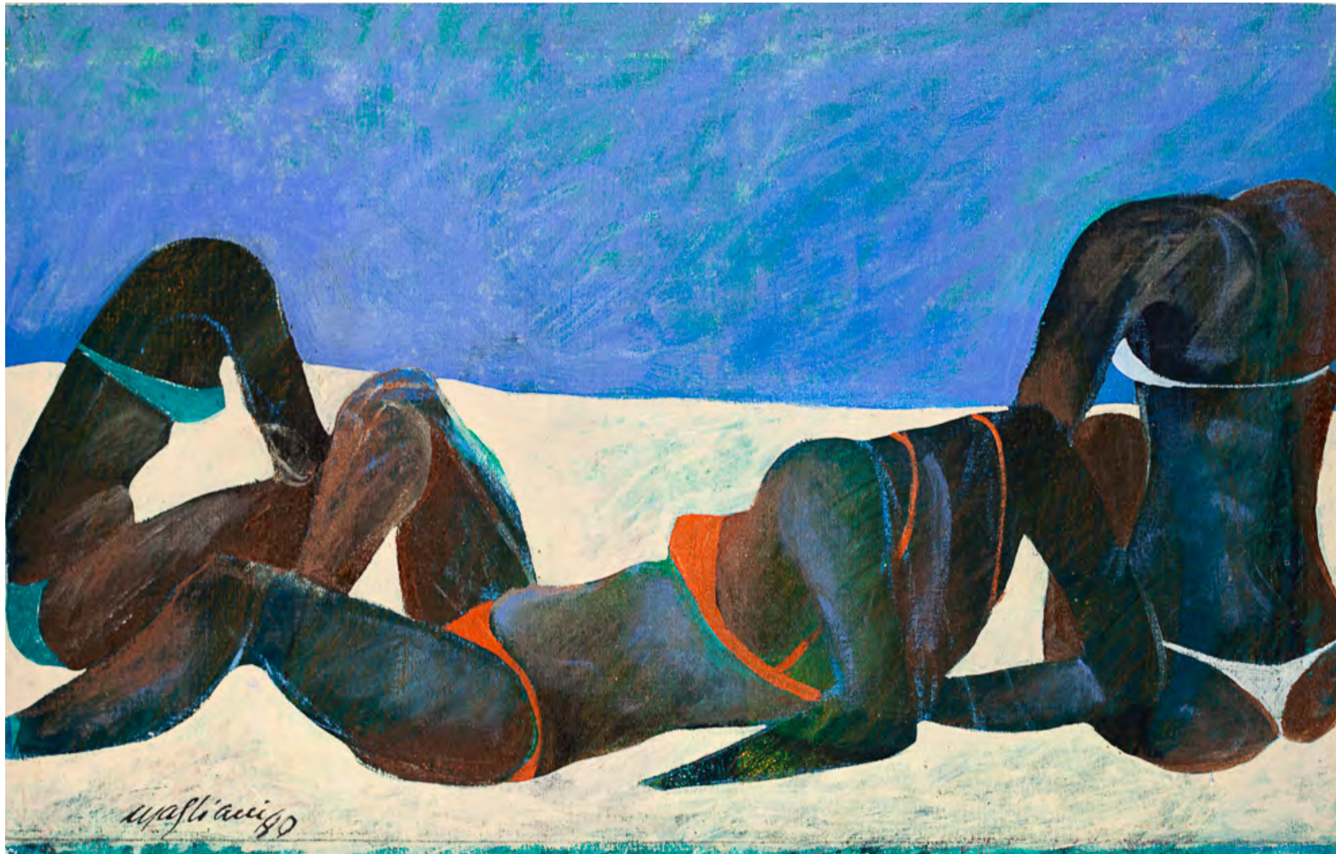
sem título - 2001 acrílica sobre tela - 28,0 x 46,0 cm obra doada por Renato Rosa