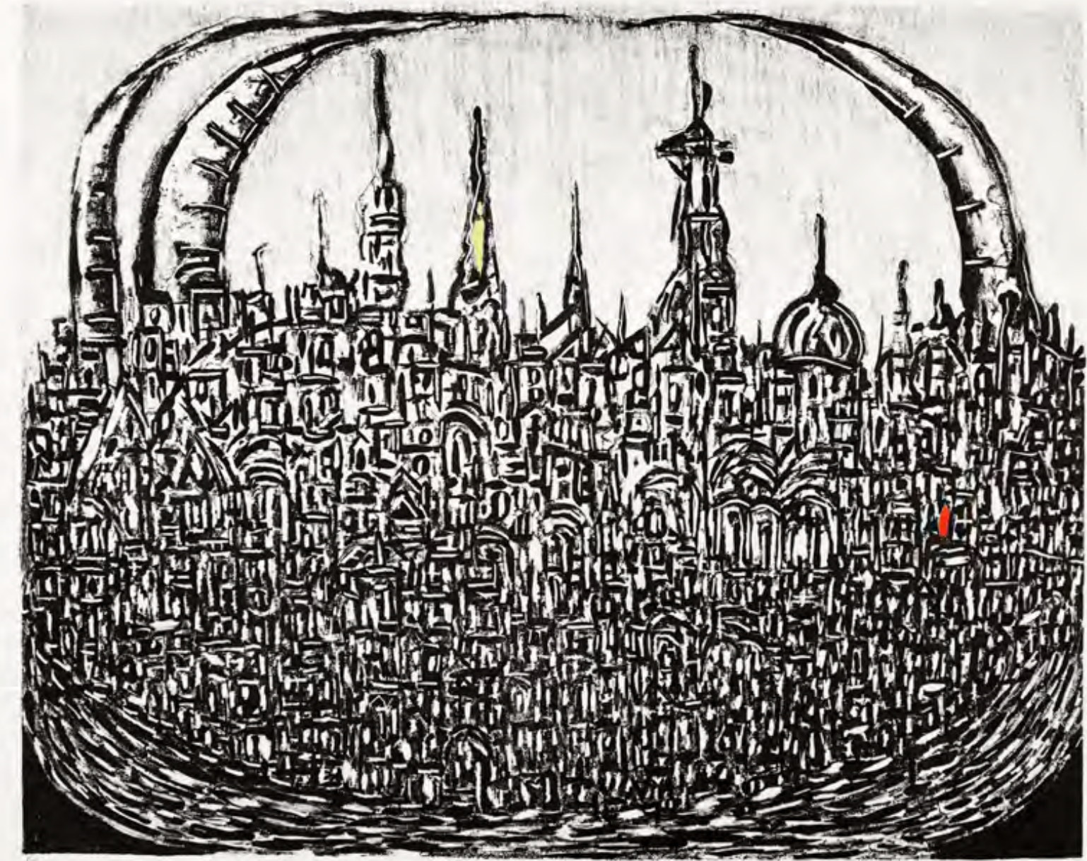
Cidade Grande II - 2009 litogravura - 37,5 x 54,7 cm obra doada pelo artista