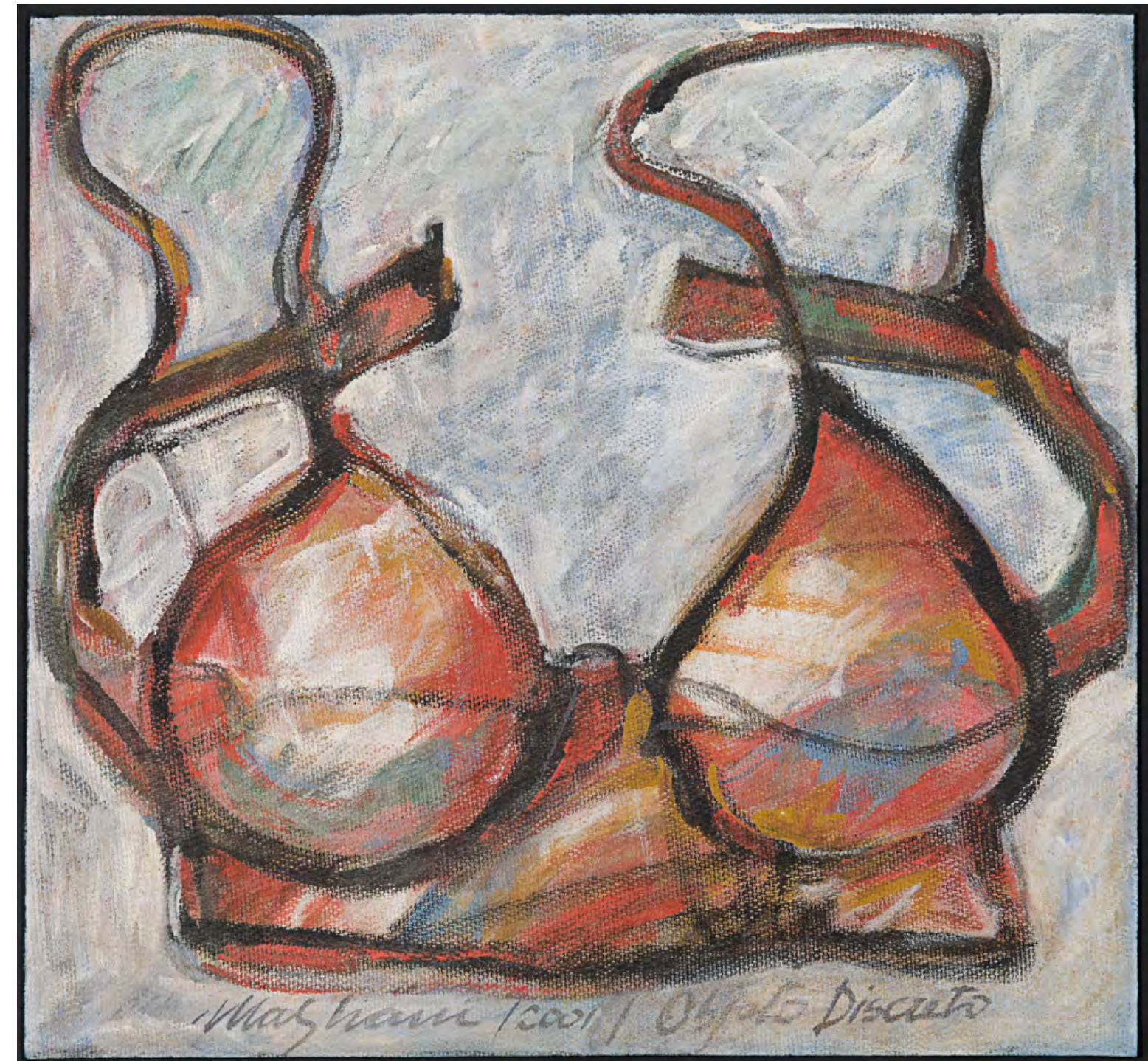
Objeto discreto - 2001 óleo e acrílica sobre tela - 56,7 x 60,3 cm obra doada por Renato Rosa