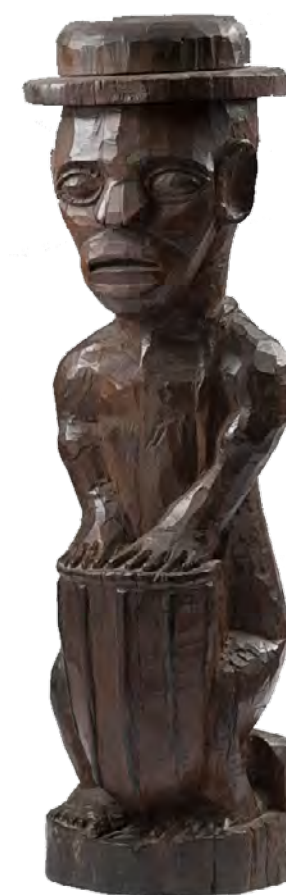
Batuqueiro - 1968 entalhe em madeira - 63,0 x 19,5 x 17,0 cm