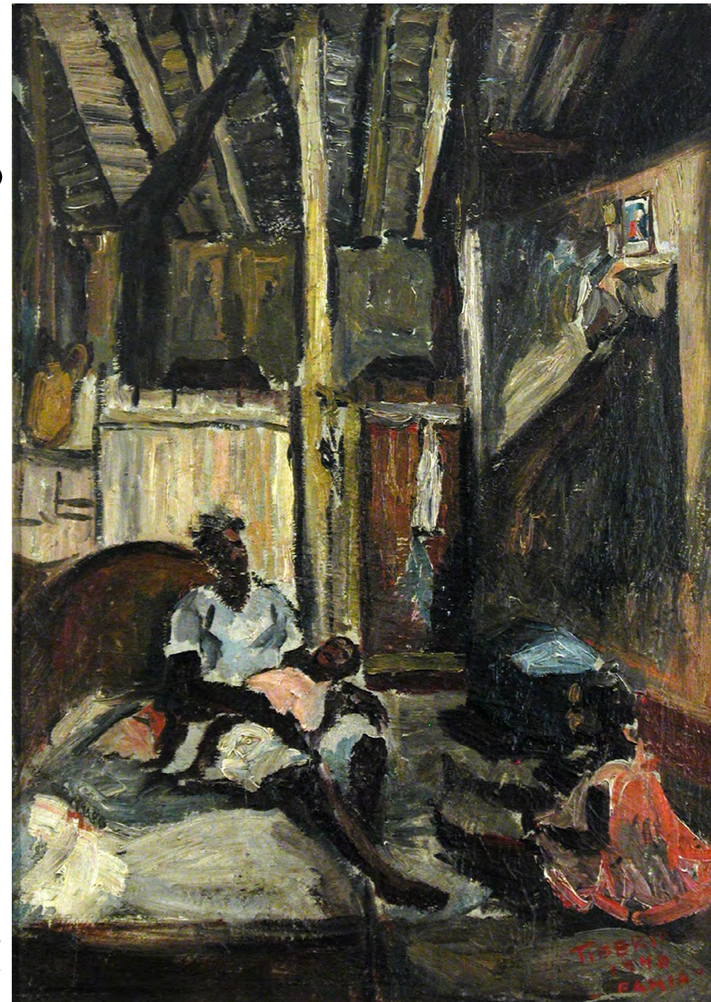
Bahia - 1946 óleo sobre tela - 66,5 x 46,5 cm