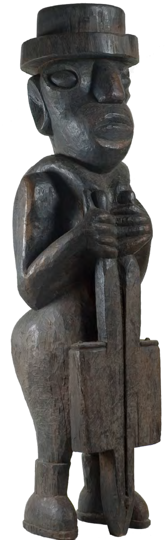
Brandão - 1971 entalhe em madeira - 175,5 x 46,0 x 50,0 cm