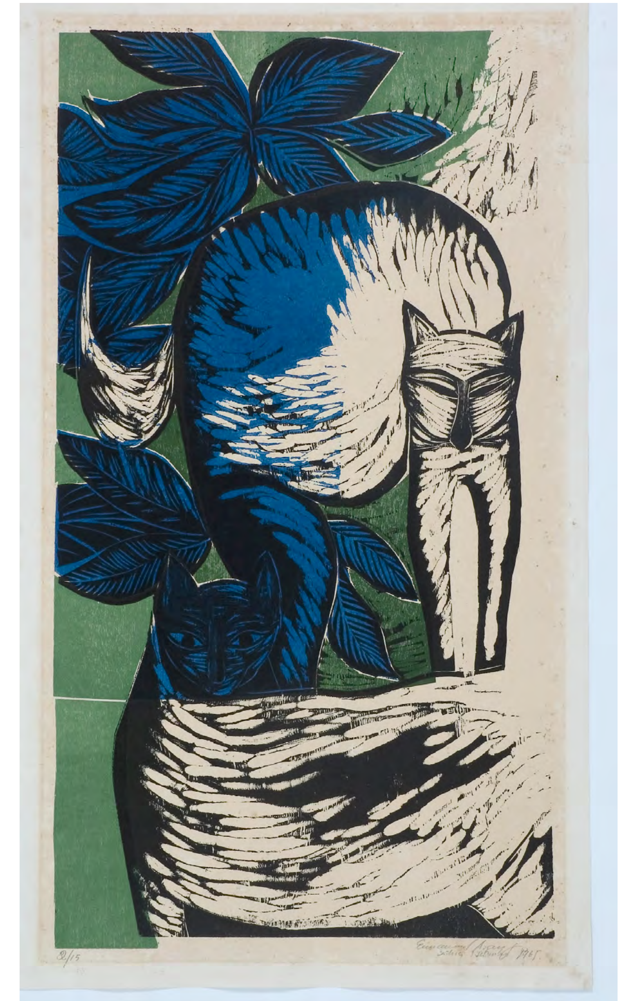
Os gatos - 1965 xilogravura - 73,0 x 39,6 cm Doação Diários e Emissoras Associados