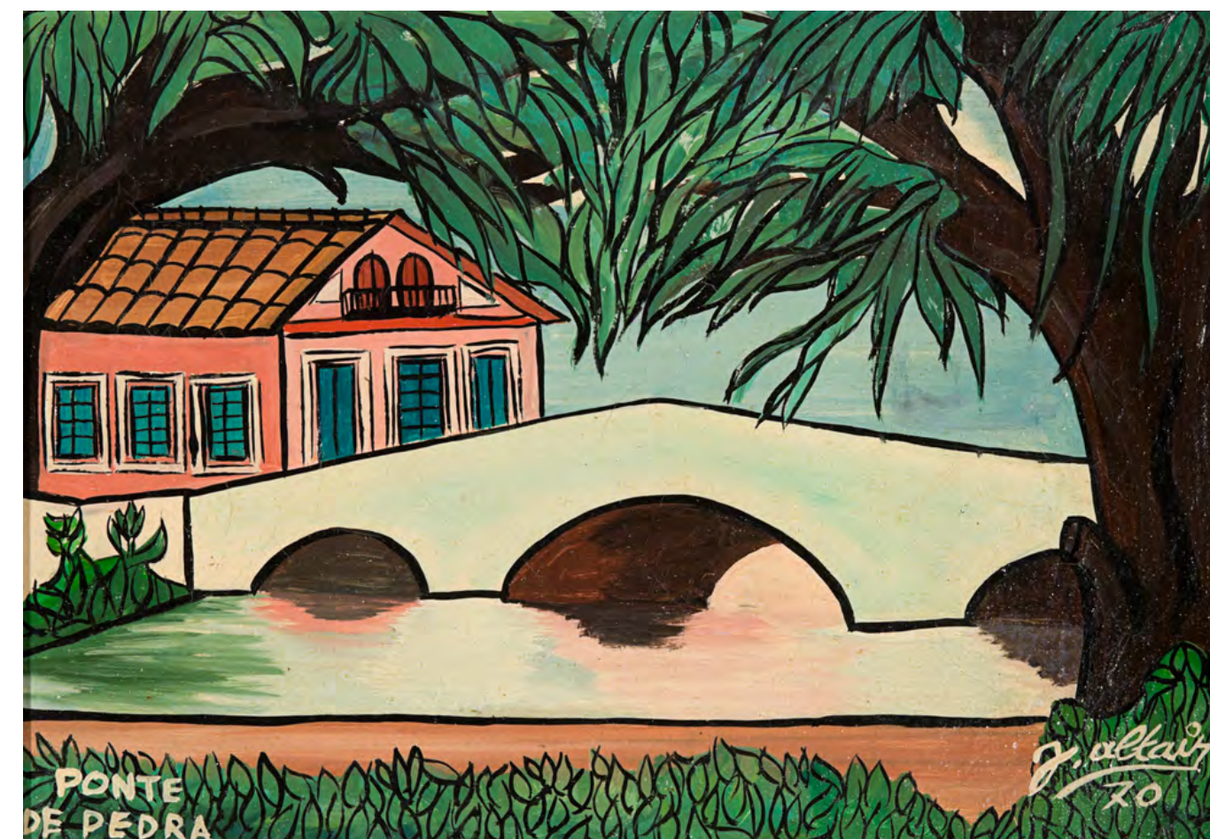
Ponte de Pedra - 1970 óleo sobre tela - 24,2 x 35,2 cm obra doada pelo artista