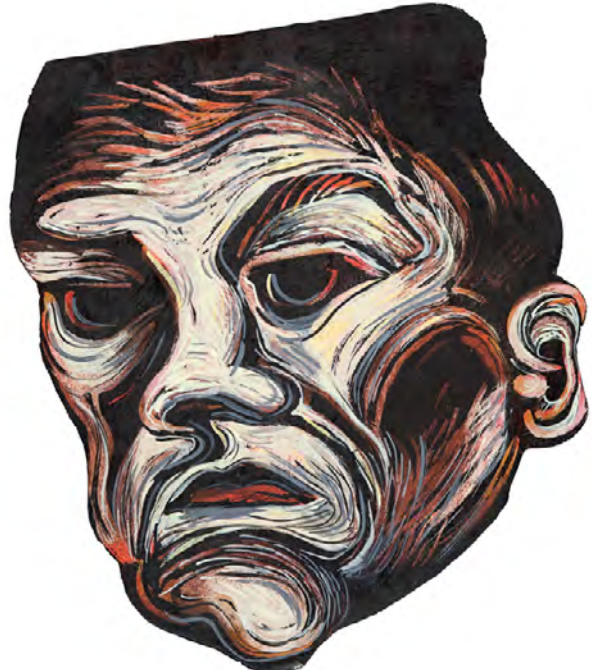
Um de todos - 2003 óleo e acrílica sobre tela - 40,0 x 34,0 cm obra doada pela artista