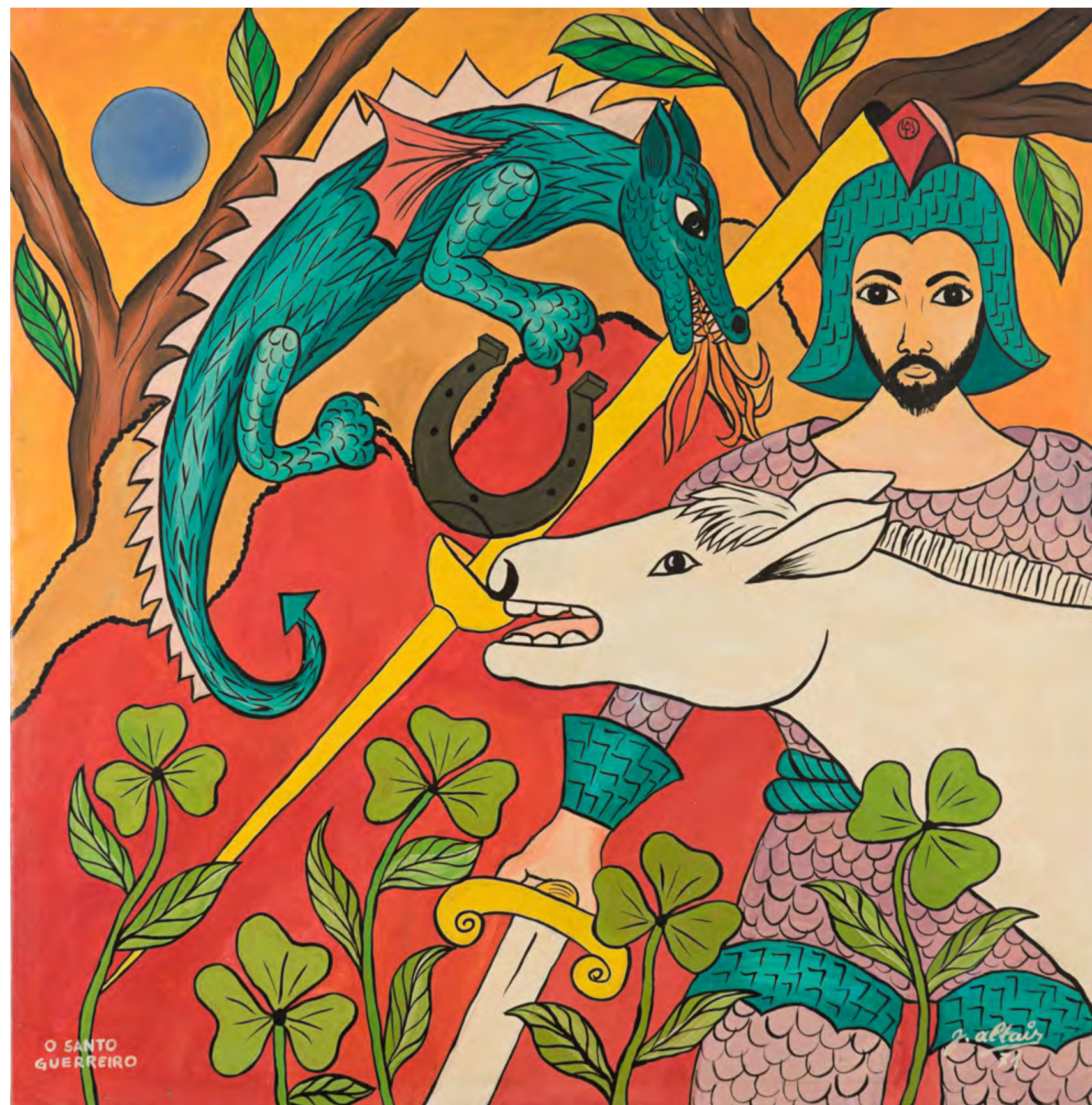
Santo Guerreiro - 1971 óleo sobre tela - 100,6 x 100,2 cm obra doada pelo artista