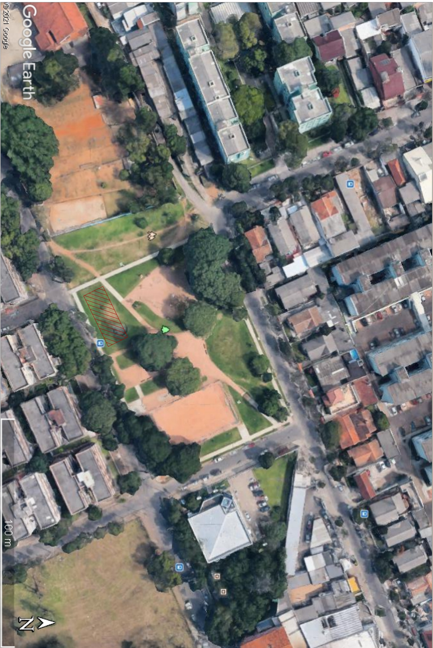
LOCALIZAÇÃO SEM ESCALA ÁREA DE INTERVENÇÃO