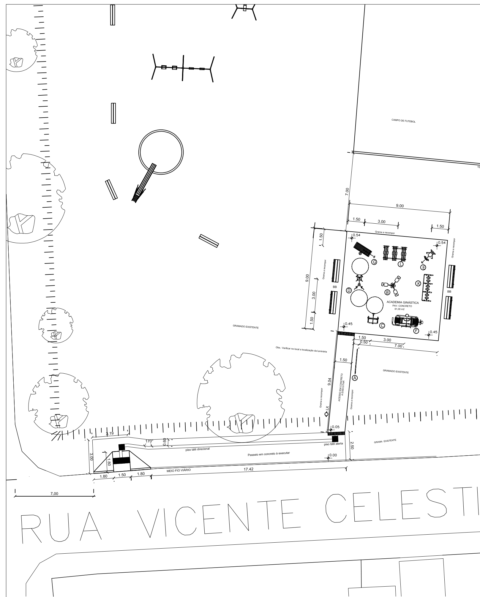
PLANTA BAIXA ESC.:1:200