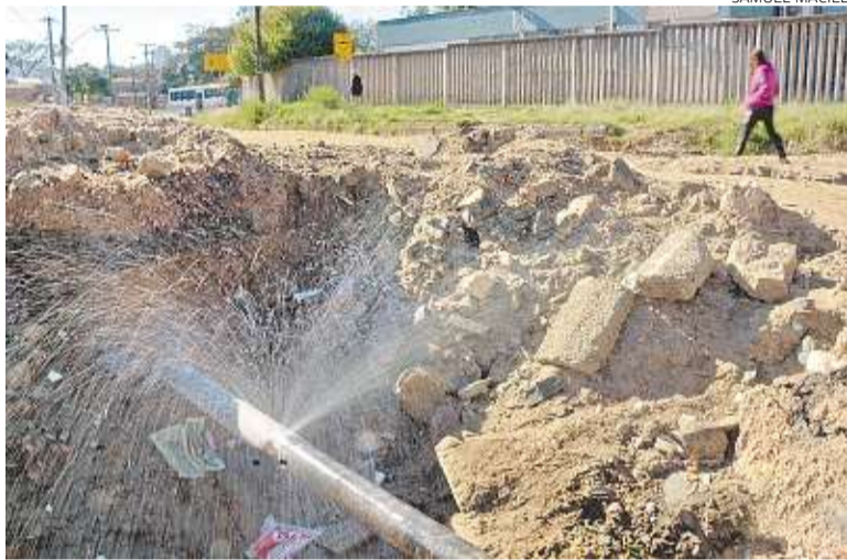
Moradores reclamam dos buracos e das más condições da via

Também há problemas de circulação para quem precisa chegar às escolas e creches da região. Conforme Santos, a comunidade enfrenta problemas com violência e falta de iluminação na região. Ele lembrou ainda que muitas famílias estão desde janeiro de 2017 sem receber o aluguel nem o bônus social do Executivo por terem deixado suas casas em função das obras. Um debate sobre a situação das obras paralisadas na avenida Tronco foi feito esta semana na Comissão de Defesa do Consumidor, Direitos Humanos e Segurança Urbana da Câmara Municipal de Porto Alegre (Cedecondh).