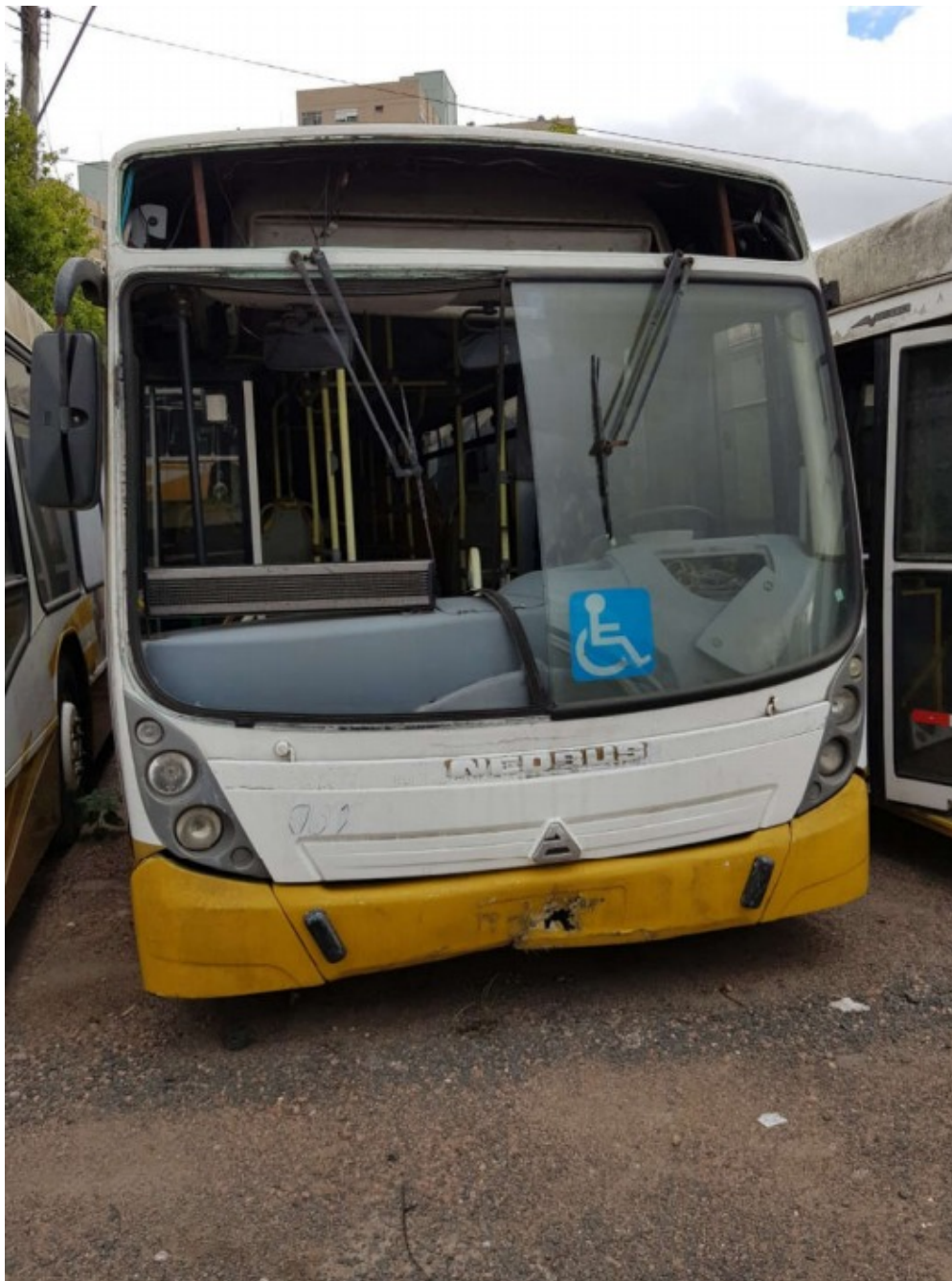
2.5. LOTE 5 - SUCATA DE ÔNIBUS , Prefixo 603, Placa IOU 2334, Chassi nº 9BYC37Z158C000698, Ano 2008, com motor, com caixa, com diferencial, com 6 (seis) pneus, valor mínimo de R$ 12.200,00.