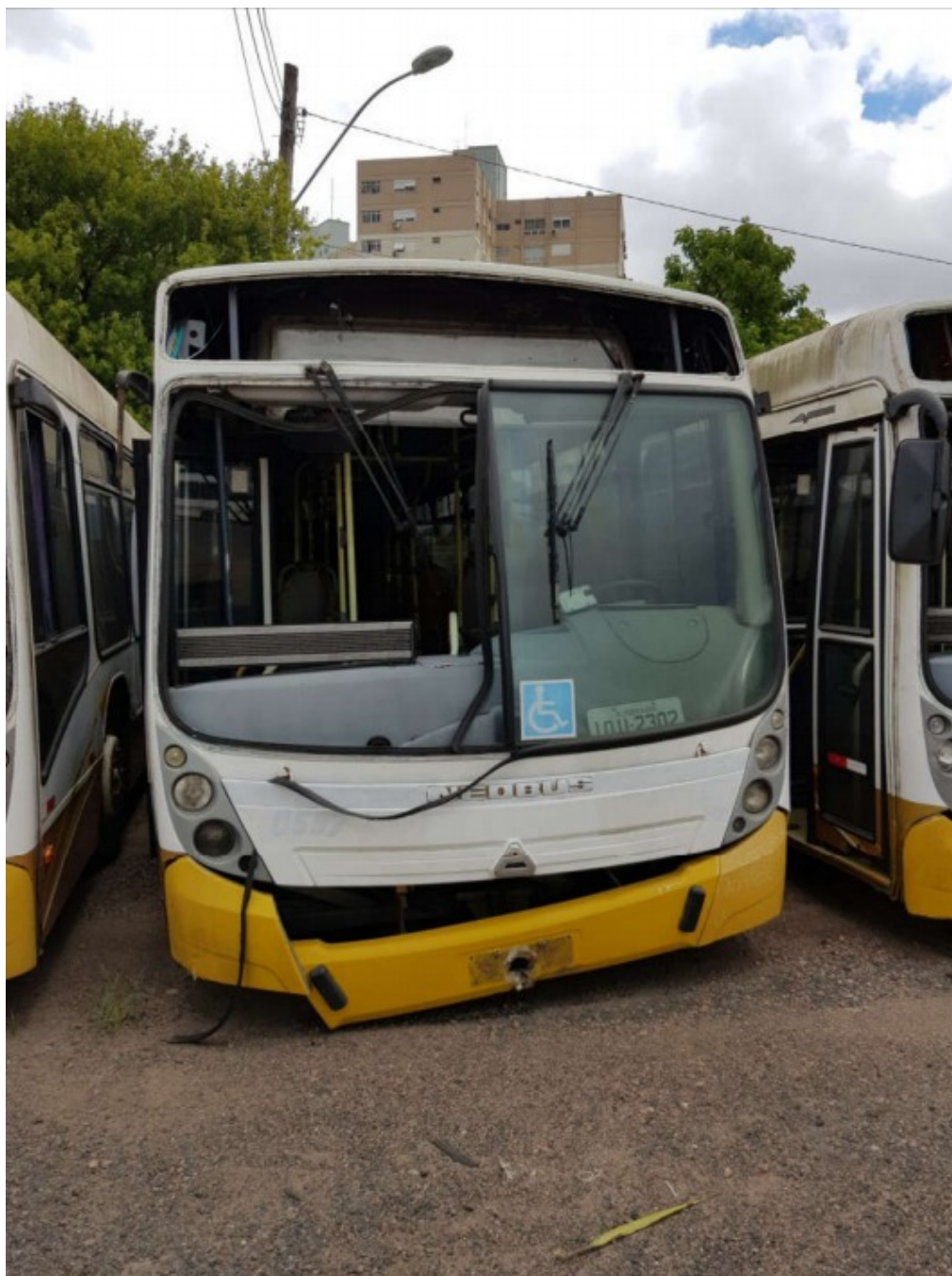
2.3. LOTE 3 - SUCATA DE ÔNIBUS , Prefixo 600, Placa IOU 2337, Chassi nº 9BYC37Z158C000695, Ano 2008, com motor, com caixa, com diferencial, com 2 (dois) pneus, valor mínimo de R$ 11.400,00.