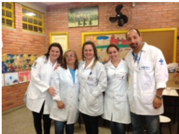
A SCS, através da UBS Ipanema, planeja ações com a Escola Gilberto Jorge.

No dia 04 de setembro, a UBS Ipanema realizou uma reunião com as professoras orientadoras da escola Gilberto Jorge para o planejamento das atividades em 2015.